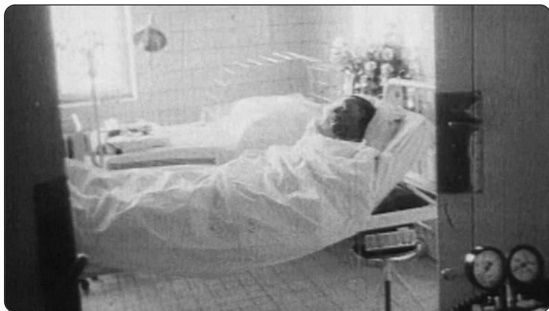
Jan Palach v nemocnici, kde ještě tři dny bojoval s blížící se smrtí. Svým těžkým zraněním 19. ledna 1969 podlehl.

chika je v takových případech křehká a že je třeba pacienty v jejich boji s tak těžkými poraněními duševně posilovat.