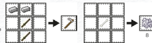
RECEPT NA ŽELEZNOU MOTYKU

6 Na zasazení semínek budete potřebovat motyku. Použijte ji na hlínu nebo travnatý blok, abyste je přeměnili na zoranou půdu, která je malinko nižší a má na sobě vlnovité rýhy na vrchní části bloku.