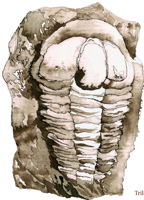
Trilobit z Jinců