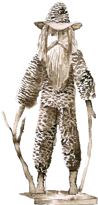
Figurka brdského ducha Fabiana

Jako člověk, který do Brd jezdil celý život, mám problém říct, co je jejich kouzlem a podstatou. Myslím, že to je kombinace chladného a čistého vzduchu, jasné odloučení od ruchu dole v hustě osídleném předhůří, nekončící lesy s křemencovými a slepencovými skalkami na dlouhých hřebenech a výhledy do krajiny, která je nejkrásnější, když se páří z lesů. V každém případě člověk vkročí do Brd a hned ví, že je „někde jinde“. Myslím, že Brdy v sobě mají něco z původní divokosti kraje, a tím se podobají Šumavě. Když pozorujete šedavý hřbítek Brd ze šumavského Libína a pak z druhé brdské strany vyhledáváte zalomenou linii Boubína, jasně vidíte, že obě pohoří lemují jednu zemi, která nemá nic společného ani s pískovci, ani se sopečnými horninami severněji ležících krajin. Brdy bývaly plné příběhů o pytlácích, kteří se nebáli přestřelek s hajnými a ctili krevní mstu.