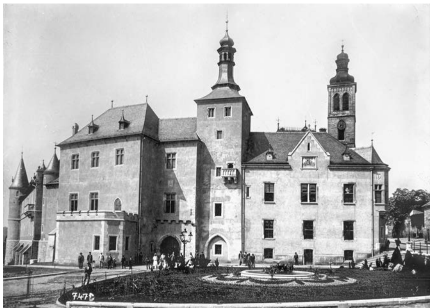
Kutná Hora, Vlašský dvůr. Hlavní průčelí.

neztratil důvěru, 150 právě naopak! V nepředvídatelném toku událostí je také méně udivující skutečnost, že se královna Žofie nevyhýbala ani Pražskému hradu, který patřil do „fyzického“ prostoru nejvyššího purkrabího, Jindřicha z Rožmberka. Jak dalece věřila tomuto muži z tábora nepřátelského vůči jejímu manželu Václavovi, těžko říci. Podstatná je skutečnost, že zřejmě důvěřovala jeho manželce Elišce z Kravař, která byla časem stejně horlivou stoupenkyní M. Jana Husa jako královna sama. 151 Nevíme však nic o délce královnina setrvání na Pražském hradě ani o jeho případném opakování. Jediným dokladem pobytu královny Žofie na Pražském hradě, ovšem bez znalosti bližších údajů, je její listina, kterou vydala 9. června 1402 „ in castro Pragensi “. 152 Není ovšem vyloučeno a je skoro pravděpodobné, že toto historické královské sídlo mohlo být