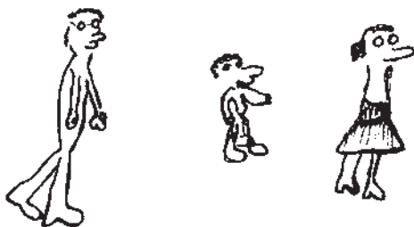
Obr. 5a. Vnitřní protest desítiletého chlapce proti rozvodu rodičů.