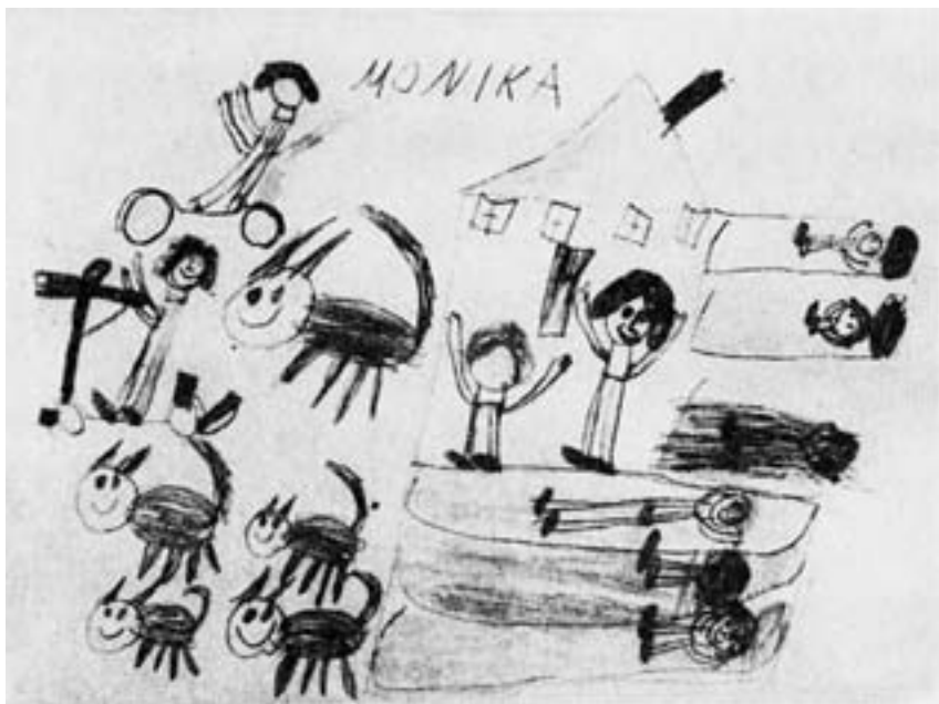
Obr. 2. Kresba šestiletého děvčete z dětské vesničky. Sebe nakreslila vedle své nové matky, se kterou se ztotožňuje v postoji i v gestech. Ostatní děti v rodině spí. Kromě rodiny jsou tu ještě jiné děti, které si venku hrají – a výrazně je tu nakresleno pět koček, které v té době skutečně ve vesničce byly a pro děvče byly mimořádně „důležité“. Nakreslila jich také správný počet, ačkoliv do pěti ještě tehdy počítat neuměla.

ne všechny jsou rodinami. Rodinu z psychologického hlediska charakterizuje zřejmě něco hlubšího a podstatnějšího, co navenek sice není tak zjevné a uchopitelné, ale co je nepochybně neméně reálné a významné.