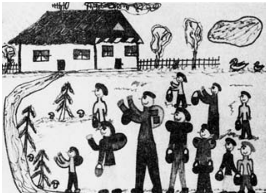
Obr. 4. Kresba chlapce z tzv. rodinné skupiny, kde manželé přijali devět dětí do pěstounské péče a vytvořili pro ně novou náhradní rodinu. Rodina je na houbařské výpravě. Dítě se zřejmě ztotožňuje s rodinným společenstvím, kde všichni něco společně podnikají.

ale současně prožíváme úzkost nad nebezpečím, které jim hrozí. Dítě je významným činitelem naší osobní identity a prestiže. To profesionální pedagog je svým způsobem nedotknutelný a neurazitelný.