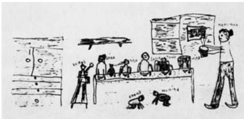
Obr. 3. Kresba desetiletého chlapce z dětské vesničky. Rodina je pojata jako místo pohody a přítom s typickým realismem dítěte středního školního věku.

modelovat. Zatímco v dětském domově, ale i v jeslích, ve škole a v jiných institucionálních zařízeních poznává dítě vychovatele především ve vztahu k sobě a nanejvýš ještě ve vztahu k druhým dětem, poznává v rodině funkci matky, otce, sourozenců, babičky, dědečka a dalších příbuzných. Poznává mužské a ženské role, poznává vztah matky k její matce a k manželově matce, poznává spoustu vztahů k lidem mimo rodinu, k listonošce, k prodavačkám v obchodech, k lékaři v ordinaci. Poznává vztahy „svých lidí“ k věcem, ke zvířatům, k práci, k myšlenkám, k ideálům.