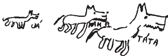
Obr. 5b. Přestože rodiče se rozvedli před půl rokem a bydlí odděleně, chlapec pojímá rodinu i začarovanou rodinu jako úplné společenství, kde lidé k sobě patří jako jeden druh zvířat, která navíc pochodují i stejným směrem.