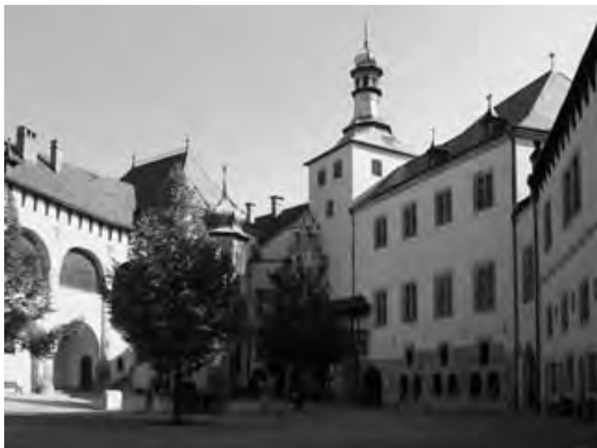
16. Vlašský dvůr v Kutné Hoře

informoval svého saského švagra. Významným návštěvám však nebyl konec. Na poděbradském hradě se objevil i hlavní stoupenec polské kandidatury mezi domácí šlechtou pan Ctibor Tovačovský z Cimburka, který doprovázel polského vyslance Dobeslava z Kurozwek zvaného Puchala. Od nich se Jindřich dozvěděl, že polský král Kazimír IV. mu v případě zvolení svého syna slibuje vymanění ze všech dluhů (budoucnost ukázala, jak byl tento slib přehnaný!) a fakticky i zachování pozice prvního muže ve státě hned po mladém Vladislavovi (i to bylo nadsazené, jak ukázal čas). Jindřich se přikláněl k linii svého otce, který si přál Jagelloncův vstup na trůn, a navíc rodina zemědělného krále stále ještě věřila v možný sňatek jeho nejmladší dcery Ludmily s mladým Vladislavem. S ohledem na saského švagra, jemuž v listu z 21. května radil, aby do Kutné Hory sám nejel, nýbrž sem vyslal své poselstvo, se ale rozhodl ponechat si prozatím volné ruce a na rozdíl od Viktorína