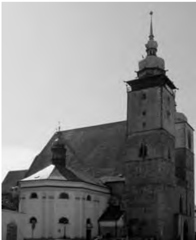
17. Farní chrám sv. Jakuba Většího v Jihlavě

nejen po Českém království, ale do vedlejších zemí Koruny. Jeden z listů dal s velkým zadostiučiněním odeslat i do slezské Vratislavi. 100