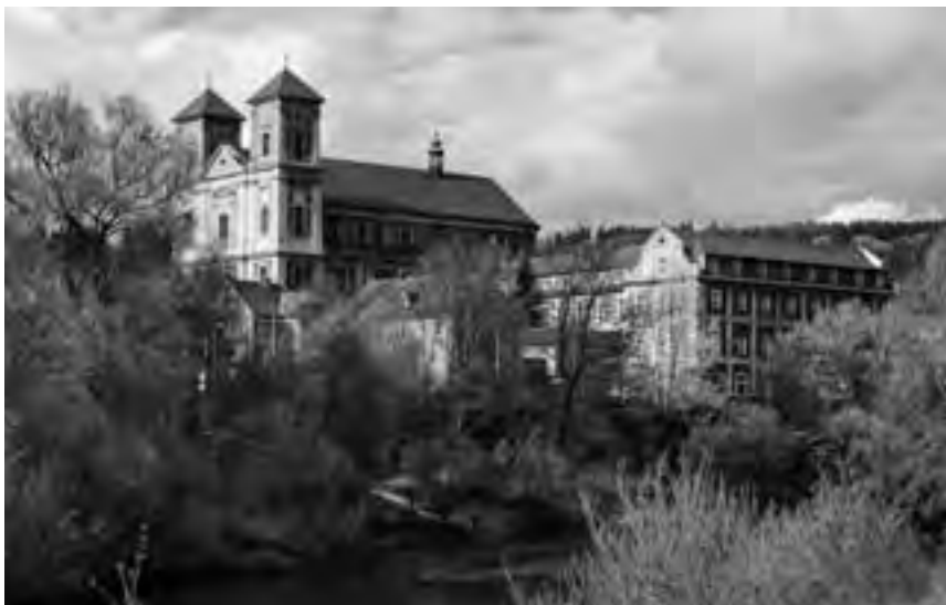
18. Warta – Bardo, kostel Nanebevzetí Panny Marie s klásterem