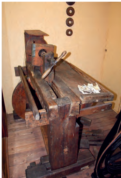
Soustruh domácí perleťářské dílny (muzeum Moravské Budějovice)

Pojem tradice se někdy užívá i k postižení technologické kontinuity řemeslné výroby. Vystihuje fakt, že se technologické zkušenosti (často jako výrobní tajemství) předávaly z otce na syna, anebo je mistr učil své tovaryše a učně. V tomto smyslu jistá tradice existovala, ale nebyla to svěrací kazajka, kterou by řemeslníci slepě nosili. Jakmile se objevila užitečná novinka, ochotně ji přijímali, protože výrobní zkušenosti nebyly věcí sentimentu, nýbrž ekonomické racionality. Nedělali to však všichni. Právě neochota technologicky zlepšovat výrobu a zajistit růst rentability (v širším smyslu tedy síla tradice) byly základní brzdou, která způsobila zaostávání cechovního systému výroby ve vztahu k pružnější konkurenci působící mimo města, která podobná omezení neměla.