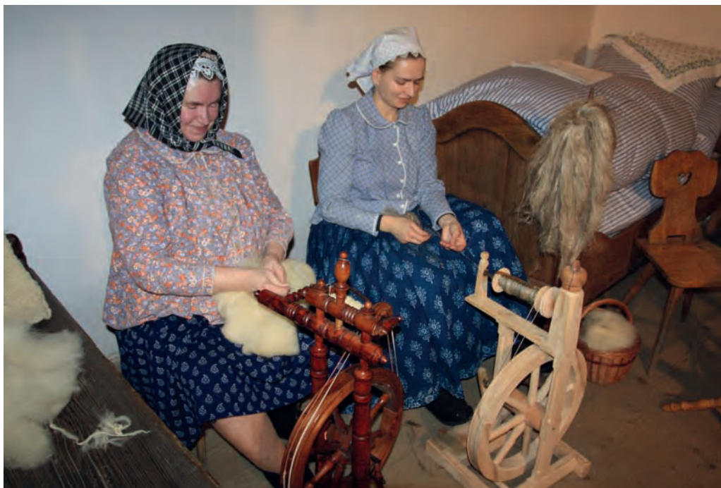
Domácké předení vlny a lnu (skanzen Rožnov pod Radhoštěm)

podkovy apod. Kromě toho kupovali keramickou produkci, protože i ta byla na jejich možnosti příliš specializovanou výrobou. Kromě výrobků kovářů a hrnčičů venkov jiné zboží nepotřeboval (nehovoříme o potravinách, například o soli). Pokud přišlo několik úrodných let a neudeřily žádné katastrofy, lidé si nějaké peníze našetřili a za ně ochotně kupovali módní zboží ve městě (především oděvy, obuv, šperky, v renesanci i některé kusy nábytku). Pokud však peníze neměli, oblečení a nábytek si zhotovovali sami. Pojem domácí práce proto nemůže označovat přesné typy výrob, neboť v každém prostředí a v každé sociální vrstvě mohl mít v průběhu staletí jiný obsah.