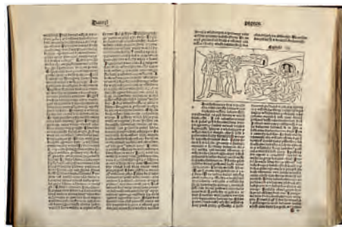
Bible kutnohorská – prvotisk (Muzeum Klatovy)

Knihtisk se záhy objevil i v českých zemích a stal se typickým městským řemeslem. Nebyl však zpočátku svázán cechovními předpisy, ba dokonce jeho provoz nepodléhal ani souhlasu panovníka. Knihtiskařství bylo na základě privilegií císaře Fridericha III. prohlášeno za svobodné umění. Sazečům dokonce císař udělil erb s orlem, presařům (tedy těm, kteří tiskli knihy pomocí lisů) pak erb s bájným ptákem Nohem, který drží v drápech tiskařské balíky (tak se nazývaly speciální tampony na stírání barvy).