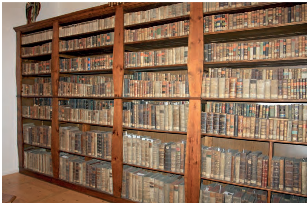
Barokní knihovna premonstrátského opatství v Milevsku

nástěnná Minucí, což byl kalendář se seznamem dnů, vhodných pro pouštění žilou (knihu sestavil univerzitní mistr Vavřinec z Rokycan a zahájil tak řadu populárních příruček s návody pro domácí lékařství). V letech 1487 až 1500 působili knihtiskaři také na Starém Městě pražském. Do konce 15. století zde vyšlo dvacet knih, bez výjimky v češtině, kromě jiných Ezopovy bajky (asi 1488), Zřízení zemské (Vladislavské) a nejslavnější tisk té doby Bible pražská (1488). Ta vyšla o rok později také v Kutné Hoře v dílně Martina z Tišnova (první jménem známý český tiskař) pod názvem Kutnohorská bible. V roce 1486 začala pracovat tiskárna v Brně a v roce 1499 v Olomouci. Obě pracovaly na objednávkou olomoucké diecéze, o čemž svědčí skladba titulů (jde o liturgické, právní a administrativně-správní příručky).