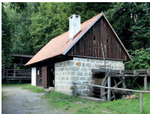
Olejna s kolem na horní náhon (skanzen Veselý Kopec)

Zpočátku šlo o výrobu drobného zboží, o kterou cechy neměly zájem. Od středověku venkované vyráběli rozmanité drobnosti (především ze dřeva), s nimiž přicházeli na trhy a prodej jim byl tolerován (násady lopat, košťata, šindele, dřeváky apod.). Domácká práce byla tedy venkovská tržně orientovaná nezemě-