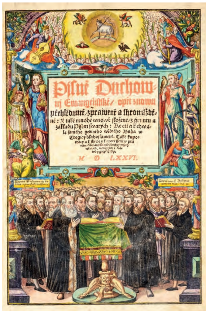
Českoobratrský tisk duchovních písní z roku 1576 (Národní knihovna v Praze)