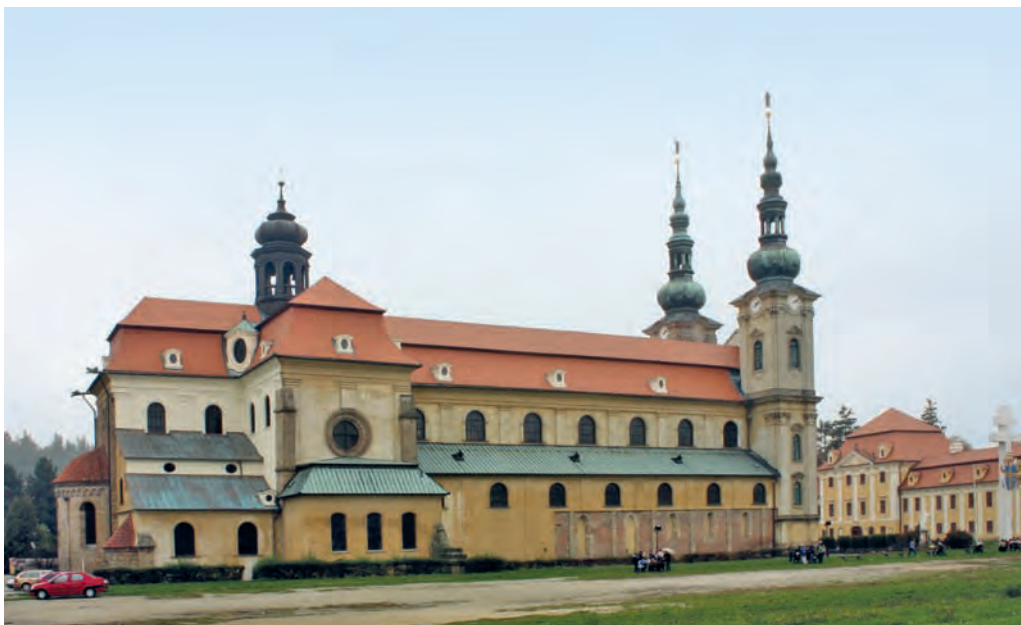
Velehrad – bazilika Nanebevzetí P. Marie a sv. Cyrila a Metoděje z 13. století, přestavba v románsko-gotickém duchu po roce 1681

především ovlivnila proměnu duchovního klimatu a přístup k životu, lidé získali ideologii, která byla v té době pokroková a společnost sjednocovala.