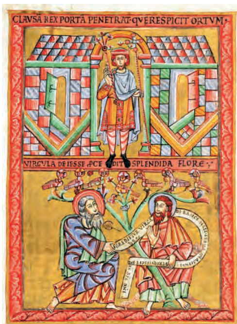
Panovník – iluminace v Kodexu vyšehradském, kolem roku 1085 (Národní knihovna v Praze)

Otevřený zápas o nadvládu v Evropě zahájila církev ve druhé polovině 11. století (první etapou byl spektakulární boj mezi papežem Řehořem VII. a císařem Jindřichem IV.). Spor byl o vymezení reálných pravomocí nad církevní hierarchií, které se v odborné literatuře nazývají investiturou. Velice schematicky šlo o to, kdo bude jmenovat biskupy a rozhodovat o správě církevního majetku. Zatímco dříve měli tuto pravomoc světští vládci, nyní si ji pro sebe začal nárokovat papež. V dlouhém a dramatickém boji, který byl osou západoevropské politiky po dlouhá dvě staletí, církev nakonec zvítězila a prosadila svou autonomii. To v praxi znamenalo, že se stala nezávislou nadnárodní politickou silou.