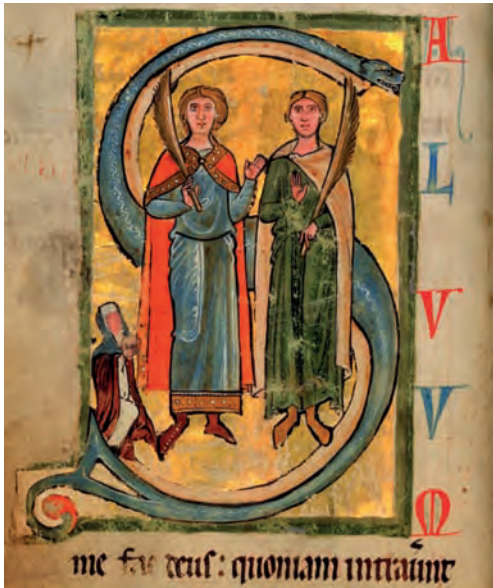
Světki a zbožná jeptiška – iluminace ve Svatojiřském žaltáři z poloviny 13. století (Národní knihovna v Praze)

měl však zdatného soka. K Ondřejovu úsilí se navíc nepřipojilo olomoucké biskupství, neboť biskup Robert se postavil na královu stranu. Biskup Ondřej jednal horlivě, ale někdy málo diplomaticky (například si proti sobě postavil kláštery, když chtěl omezit jejich majetková práva ve prospěch diecéze). Ze svých původních požadavků prosadil nakonec jen zlomek. I tak to byl pro církev významný úspěch.