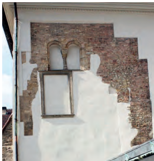
Pražský hrad – zbytky románského biskupského paláce

Nejvyšší církevní hodnostářé jmenoval v novém uspořádání papež a císař je pouze formálně potvrzoval. Církev začala zcela nezávisle spravovat svůj majetek. Papež tím získal nástroj proti odbojným prelátům, jimž mohl přidělenou prebendu odejmout (tedy moderním jazykem propustit ze zaměstnání). Tato pravomoc vedla rychle k centralizaci církevní správy a její orientaci na Řím. Papežská kurie začala na všech křesťanských územích vést svou vlastní politiku, která byla mnohdy v příkrém rozporu se zájmy světských panovníků.