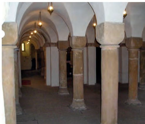
Stará Boleslav – krypta v kostele sv. Václava z 11. století

(Kosmova kronika – O založení pražského biskupství v roce 976)