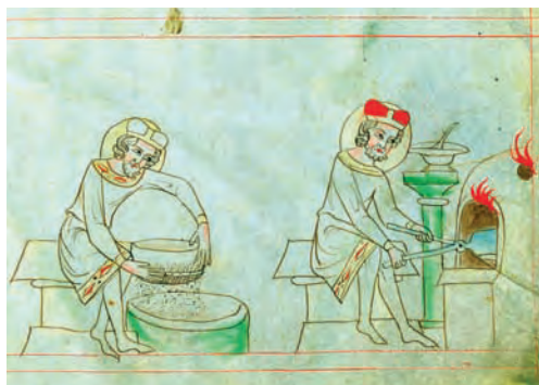
Sv. Václav připravuje hostie – iluminace ve Velislavově bibli, kolem roku 1340 (Národní knihovna v Praze)

cestou procházela transformace pohanských rituálů v celé křesťanské Evropě.