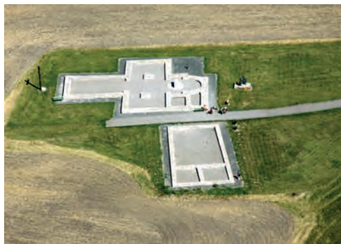
Libice nad Cidlinou – základy paláce a tribunového kostela (původně asi spojené dřevěným můstkem)

Křesťanské bohoslužby měly v době christianizace našich zemí ještě daleko do závazně strukturované podoby pozdějších mší (unifikaci provedl v rámci křesťanské Evropy až IV. lateránský koncil v roce 1215). Mše si až do 12. století podržely jednoduché symboly z časů prvních křesťanů, ale současně akceptovaly domácí rituály (na to narážejí výtky církevních učenců z 12. a 13. století). Také normy křesťanského života, jak je známe později z vrcholného středověku, nebyly až do konce 12. století známé. Lid