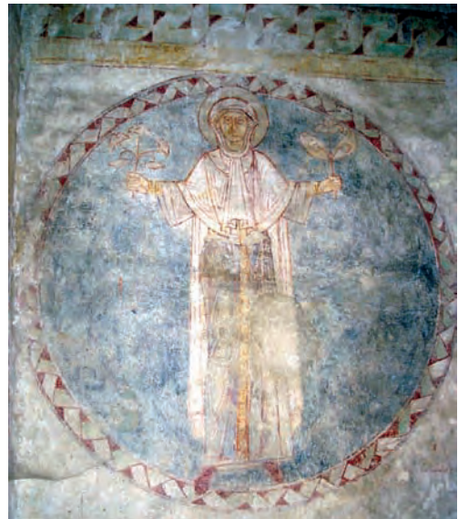
Stará Boleslav – alegorická postava v kostele sv. Klimenta z 3. čtvrtiny 13. století

Růst vlivu církve sice vytvářel potenciální nebezpečí pro budoucnost, ale z pohledu situace ve 13. století přinesl zemi pokrok, který se promítl v hospodářském a mocenském vzestupu Českého království. Církev