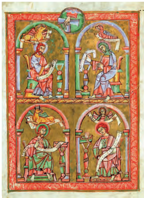
Čtveřice evangelistů – iluminace v Kodexu vyšehradském, kolem roku 1085 (Národní knihovna v Praze)

Hlavním důvodem šíření křesťanství byl boj o moc. Křesťanství se v době merovejské a karlovské stalo oficiálním státním náboženstvím francké říše a posléze celé západní Evropy. V mocenském boji platí, že je vždy třeba najít morální důvod, který dává útočníkovi právo napadnout svého souseda. To je nadčasový princip, který v lidských dějinách fungoval vždy stejně. Šíření křesťanství se v době raného i vrcholného středověku stalo tím nejlepším ospravedlněním agrese. Pod politickým tlakem pak celkem logicky mocenské elity slabších zemí přijímaly křesťanství, aby nepřátelským sousedům vzaly záminku k napadení svých území.