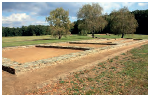
Mikulčice – základy velkomoravské baziliky

To byl také základní důvod, proč křesťanství přijali vládci velkomoravské říše. Současně přinášela konverze možnost politického lavírování. Kniže Rostislav byl dostatečně mocný, aby mohl vojensky zápasit s římskými císaři, proto se obrátil na byzantského císaře s žádostí o vyslání slovanských věrozvěstů. Tento krok měl v první řadě politický význam (byť určitý podíl víry nelze v politice středověku nikdy podceňovat). Východní orientace velkomoravského