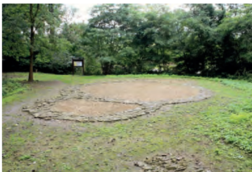
Mikulčice – základy dvouapsidové rotundy

dvora byla logická, protože politická autorita Konstantinopole byla v té době ještě obrovská (na rozdíl od reálné vojenské síly).