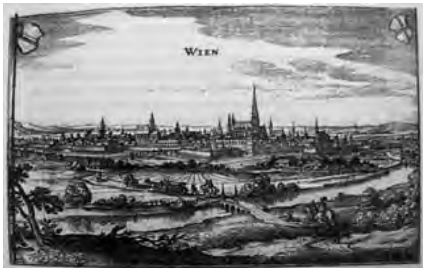
Vídeň na rytině z první poloviny 17. století