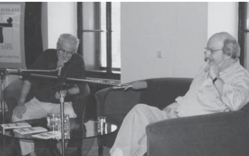
S americkým spisovatelem Edgarem Lawrenceem Doctorowem na Světovém kongresu PEN klubu v Praze v roce 1994.