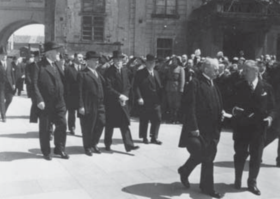
Premiér Jan Malypetr mezi prezidentem Masarykem a sociálnědemokratickým předsedou Senátu Františkem Soukupem na nádvoří Pražského hradu.