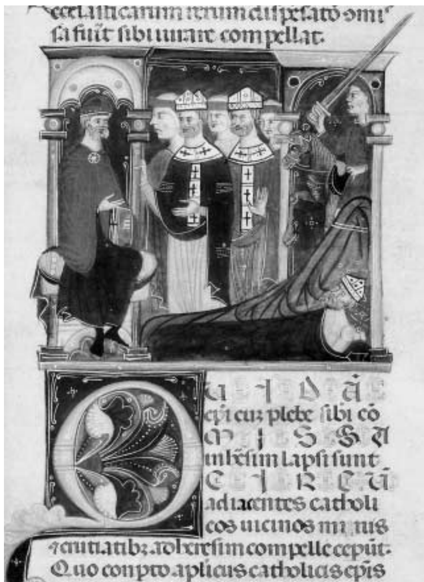
1. Světá moc zasahuje proti biskupům upadnuvším do kacířství. Franciscus Gratianus de Garratoribus, Decretum, Itálie, Bologna, konec 13. stol. Praha, Knihovna Národního Muzea XII A 12, fol. 204r.