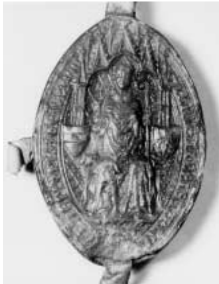
6. Velká pečeť, kterou Arnošt z Pardubic užíval jako pražský biskup.

Arnošt ve funkci děkana odešel roku 1342 spolu s kanovníkem téže pražské kapituly a levobočkem krále Jana Mikulášem z Lucemburku znovu do Avignonu, tentokrát už plně jako králův vyslanec. Jejich jednání s Klimentem VI. 67 se už asi týkala i důležité věci přípravy budoucího pražského arcibiskupství, jak už k tomu, ještě před odchodem poselstva do Avignonu, byly učiněny první kroky zajištěním budoucí novostavby gotické katedrály. Arnošt už v tu dobu nebyl u kurie neznámým člověkem, ale byl papežským kaplanem 68 a člověkem respektovaným a důvěryhodným natolik, že tu zřejmě byl kolem poloviny roku 1342 jmenován kolektorem papežských desátků. Nedochoval se o tom přímý doklad, ale usuzovat na to dovoluje skutečnost, že během tehdejšího pobytu v Avignonu získal Arnošt na základě supliky obou královských vyslanců, tj. své a Mikuláše z Lucemburku, uvolněný kanonikát a prebendu ve Vratislavi,