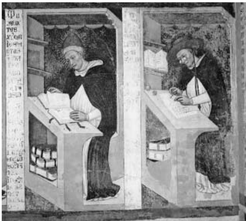
3. Tomaso da Modena, papež Benedikt XI. a kardinál Hugues de St. Cher (Niccolò Bocasini), nástěnná malba v kapitulní síni dominikánského kláštera sv. Mikuláše, Treviso, kolem roku 1340–1350.

měl svůj pevný, na jasném právu spočívající řád již z doby Benediktova předchůdce Jana XXII., 53 k Janovým řádům pro kancelář, rotu a audientii litterarum contradictarum (vše z roku 1331) 54 přidal Benedikt jako poslední ještě řád pro penitenciarii a upravil činnost advokátů a prokurátorů. 55 Přitom hladký chod obrovského kuriálního centra, později zplanělý, byl vytvořen jako podpora pro realizaci církevní reformy sui generis, již sloužil a jež spočívala na uplatnění jednotných požadavků do praxe uvedeného kanonického práva a na něm spočívající správy všech kurátních i nekurátních beneficií kdekoliv v latinské Evropě. 56 Později tak neblaze proslulý provizní systém vznikl jako pomůcka pro vytvoření