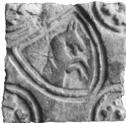
5. Znak Arnošta z Pardubic, gotický kachel z biskupského paláce na Malé Straně v Praze.

První doklady o Arnoštovi z Pardubic ho tedy spojují s Janem Lucemburským; všechna dosavadní literatura s naprostou samozřejmostí váže jeho vzestup na Karla IV. Přispěl k tomu jistě budoucí časový souběh působení obou mužů a jejich pozdější shoda a spolupráce, ale také jistá tradiční nechuť české historiografie ke králi Janovi. V letech 1338–1339 byl dosud králem Jan, byl to on, kdo byl při kurii dobře znám, kdo jako král korespondoval s papežem a vedl tu četná diplomatická jednání. Ostatně byl snad Arnoštův otec kdysi „zaměstnancem“ krále Jana a i to mohlo u něj mluvit ve prospěch syna. Arnošt se kolem roku 1333 opravdu mohl v Itálii, v době pokusu o Janovu severoitalskou signorii, setkat jak s Janem tak s Karlem Lucemburskými, ale nevíme o tom naprosto nic