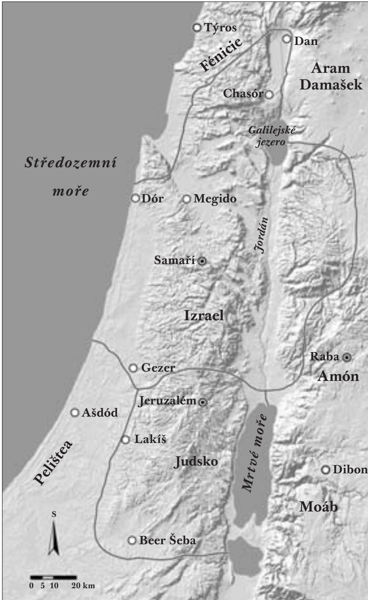
Obr. 1: Mapa Izraele a Judska v 8. století př. n. l.

[16]..... Proč psát knihu o severním království?