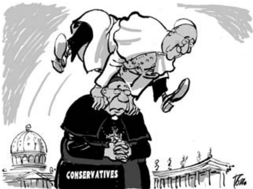
(26) Papež a vatikánští konzervativci.