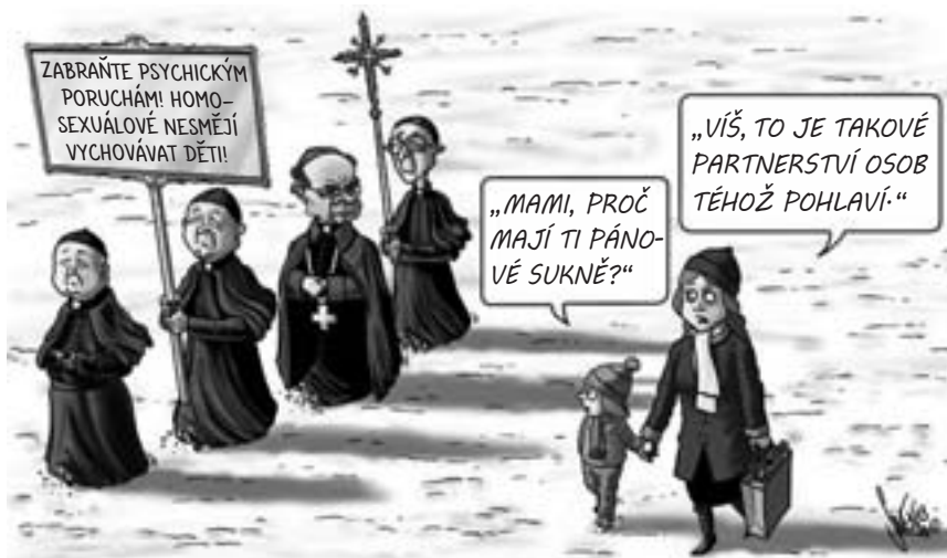
(24) Homosexuálové nesmějí vychovávat děti – partnerství osob téhož pohlaví.