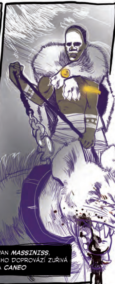
NUMIDAN MASSINISS, KTERÉHO DOPROVÁZÍ ŽURIVÁ HYENA CANEO