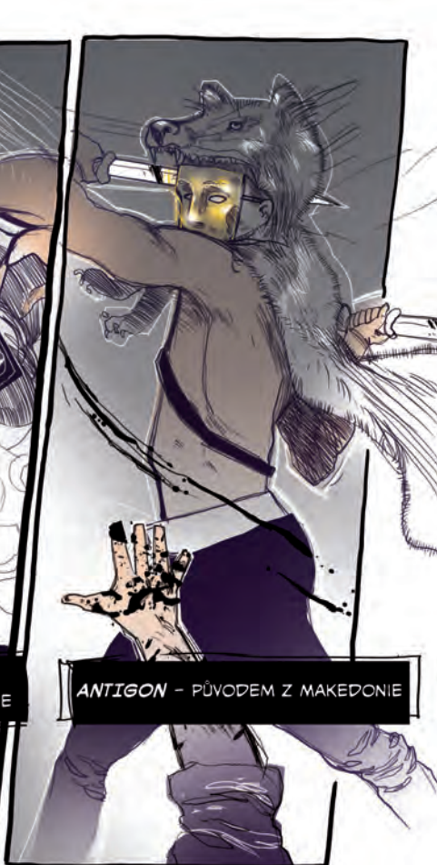
ANTIGON - PŮVODEM Z MAKEDONIE