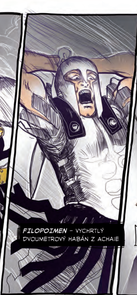
FILOPOIMEN - VYCHRTLÝ DVOUMETROVÝ HABÁN Z ACHAIE