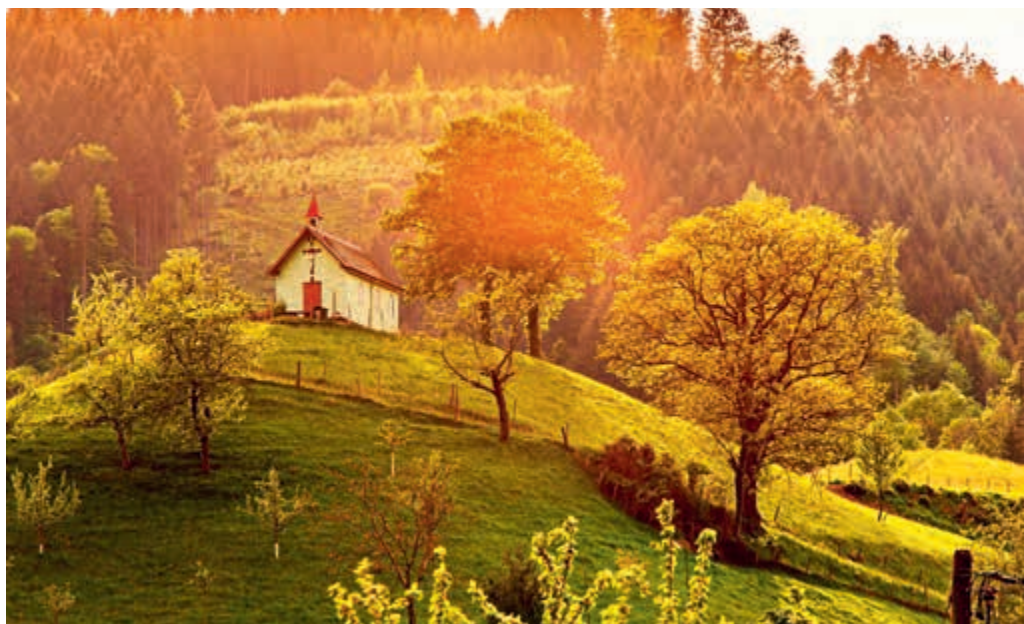
Romantické údolí Simonswälder

přijel teprve mnohem později, ale hornbergští už všechen svůj prach vystříleli... Každý rok v létě ukazují hornbergští na obnovené scéně pod širým nebem ve Storenwaldu původ tohoto slavného německého přísloví.