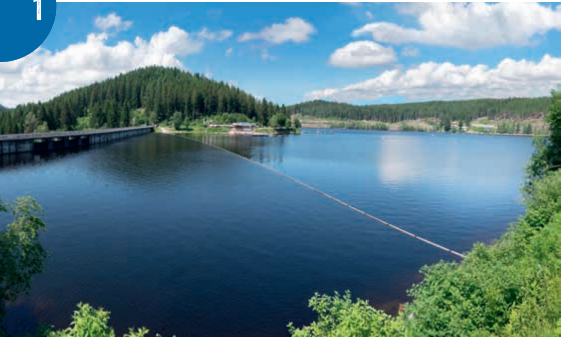
Největší jezero ve Schwarzwaldu – Schluchsee