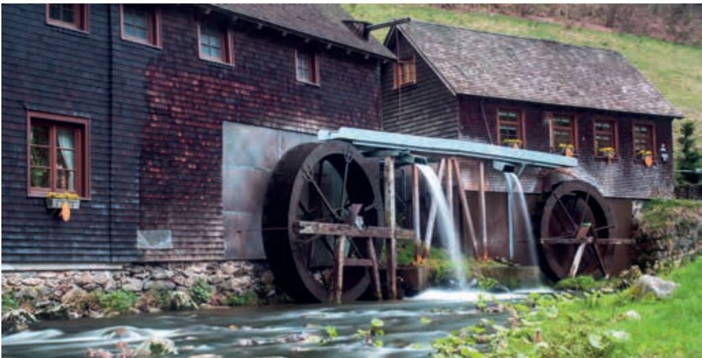
Překrásné místo opředené příběhy – mlýn Hexenloch nedaleko Furtwangenu