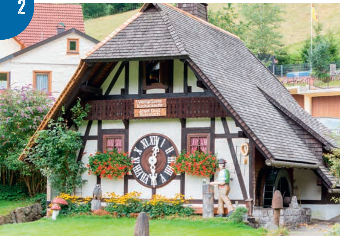
Čilé městečko Triberg, město legendárních kukačkových hodin