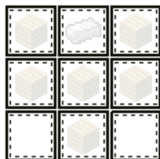
RECEPT NA ŠTÍT