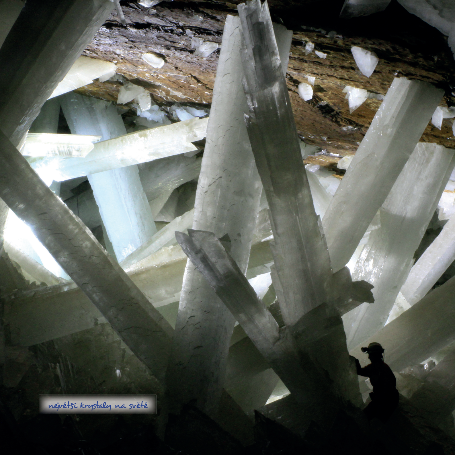
největší krystaly na světě