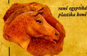
rané egyptská plastika koně

asi 2000 př. n. l. Do Egypta se poprvé dostávají koně.