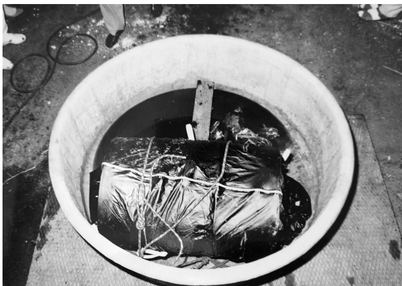
Kád se sudem