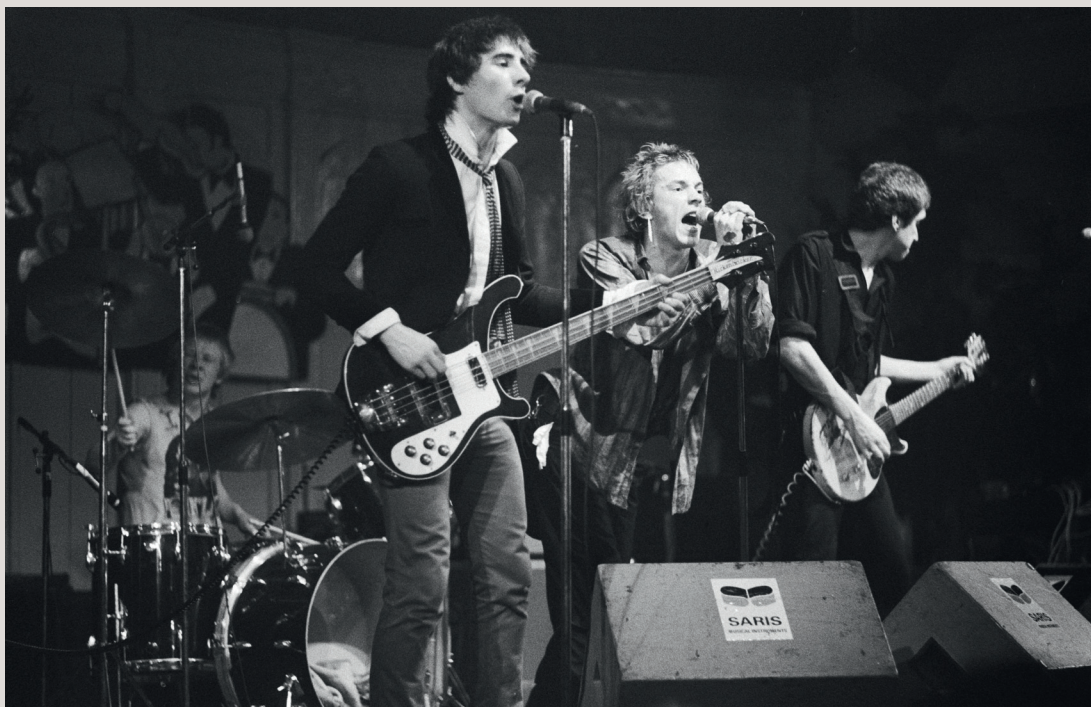
Sex Pistols | 5

Na svoje poslední společné turné vyjíždí kapela Sex Pistols . Během turné, které provází množství skandálů, se kapela rozpadla. Nejznámějším incidentem je ten, kdy se člen kapely řízl do hrudi a postříkal svou krví ženu snažící se vylézt na pódium.