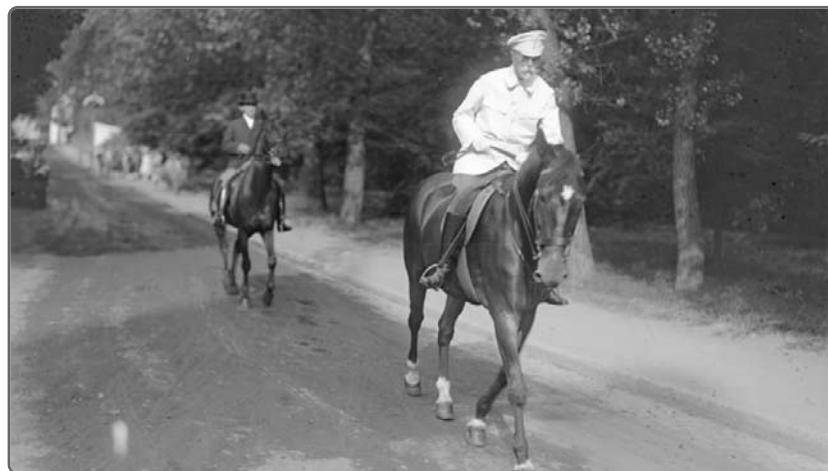
T. G. Masaryk s oblibou jezdil na koni. Projížďky byly pro něj nejen sportovním vyžitím, ale i jedním ze způsobů relaxace.

V T. G. Masarykovi získala první republika státníka a osobnost, která měla vlastní politické vize i poměrně vyhraněné názory na to, jakým směrem se má budování československého státu ubírat. Sám