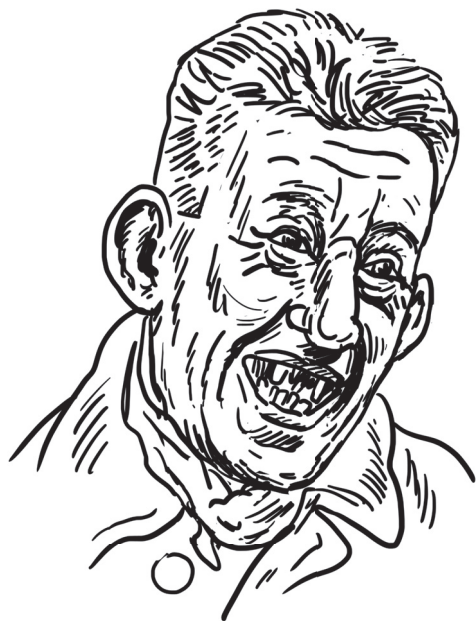
„Mééé!“ aneb není malých rolí

NEJLEPŠÍ PAS – Kompas. Po převratu roku 1948 došlo k podstatnému omezení svobody cestování, cestovní pas se tudíž stal věcí takřka k nepotřebě. Jelikož