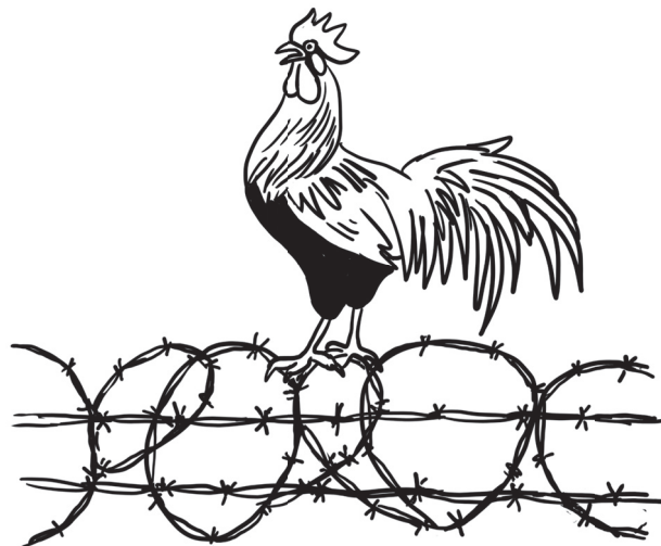
„Kykryryký, já mažu z republiky!“