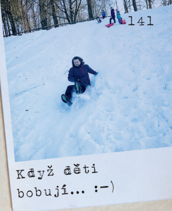
Když děti bobují... :-)

Za posledních pár let se totiž komplet obměnilo zvířecí osazenstvo statku. Nejdřív kočičky a pak jsme se smutkem museli pohřbít i dva staré pejsky. A přestože se Ríšova maminka dušovala,