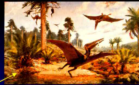
Jurský ptakoještěř Pterodactylus byl létající plaz.