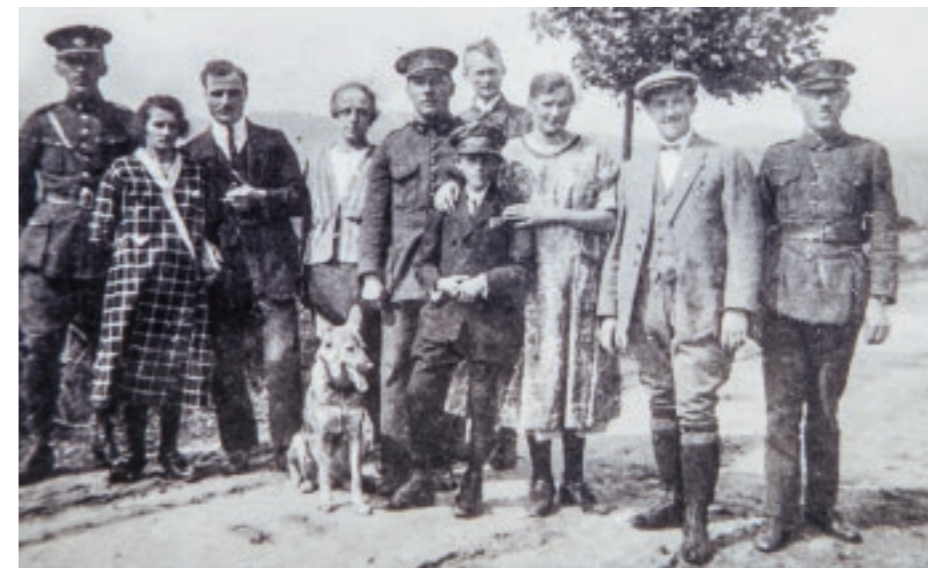
▪ Finanční stráž neboli financové patřili neodmyslitelně k tomuto kraji. Hranice s Bavorskem byla na dohled.