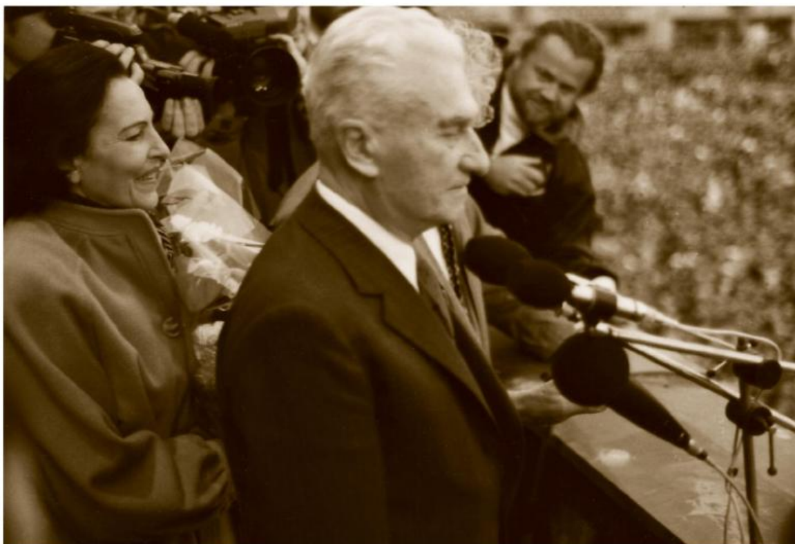
Tomáš Baťa dojatě shlíží na zaplněné zlínské náměstí