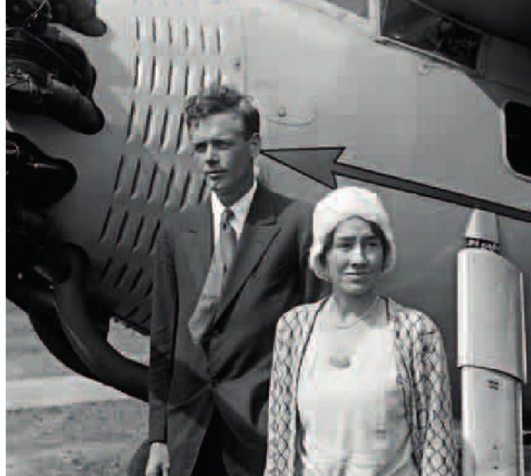
Charles Lindbergh se svou ženou Annou Morrow Lindberghovou.

13. února 1935 ho porota jednomyslně uznala vinným a byl odsouzen k trestu smrti. On sám se však k činu nikdy nepřiznal a až do úplného konce tvrdil, že je nevinný. Z vězení poslal několik žádostí o milost, všechny však byly zamítnuty.