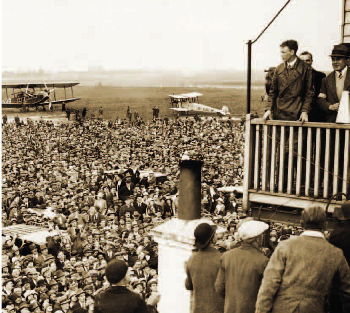
Stejně bouřlivého uvítání jako v Paříži se Lindberghovi dostalo i po přeletu do Croydonu ve Velké Británii.