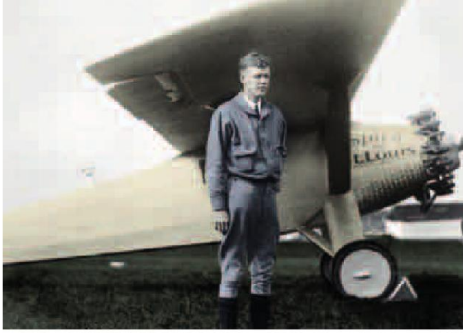
Lindbergh se svým jednomotorovým strojem Spirit of St. Louis.

Zajímavé je, že prvních pět let se o získání ceny vůbec nikdo nepokusil, protože náklady spojené s investicemi do vývoje strojů několikanásobně převyšovaly vypsanou cenu a navíc – riziko bylo obrovské. Teprve v roce 1924 přišly první pokusy, které však pokaždé skončily nezdarem. Letadla totiž musela být vybavena velkými nádržemi benzínu a v lepším případě se vůbec nedokázala odlepit od země. V horším havarovala. Při sedmi různých nehodách se šest letců zabilo a tři další byli vážně zraněni.