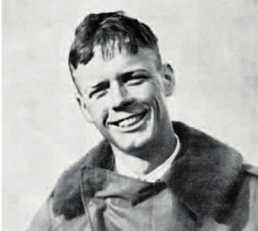
Charles Lindbergh (1902–1974), americký letec, známý také jako Lucky Lindy nebo Osamělý orel.

Lindberghův další život už tak zářivý nebyl. V roce 1932 byl unesen a zavražděn jeho dvouletý syn. Média