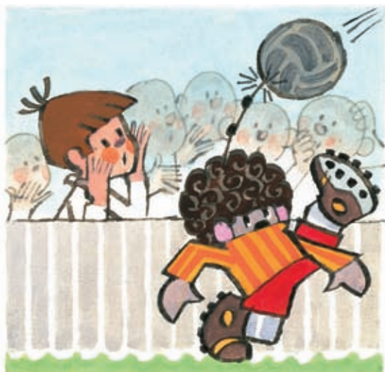
7 Jé, průšvih – anténa!