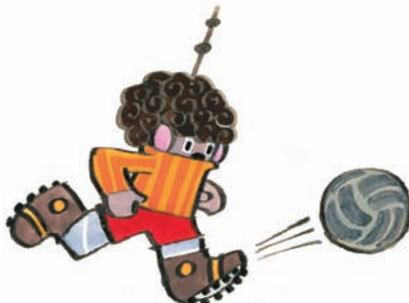
5 Výborně, Miki! Dotáhni to aspoň do stovky!