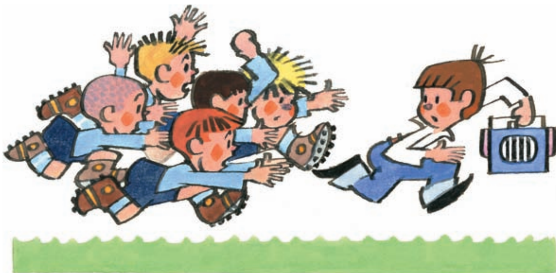
9 Nám neutečeš... Teď bude robot náš!