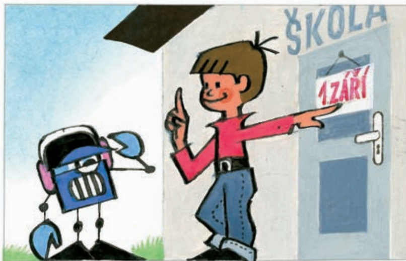
3 Miki splní každé přání, pane můj. – Zaříd', ať zítra není škola!