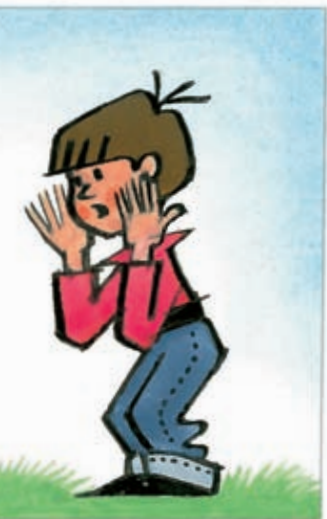
2 Propána... ono to má nohy... A mluví to!