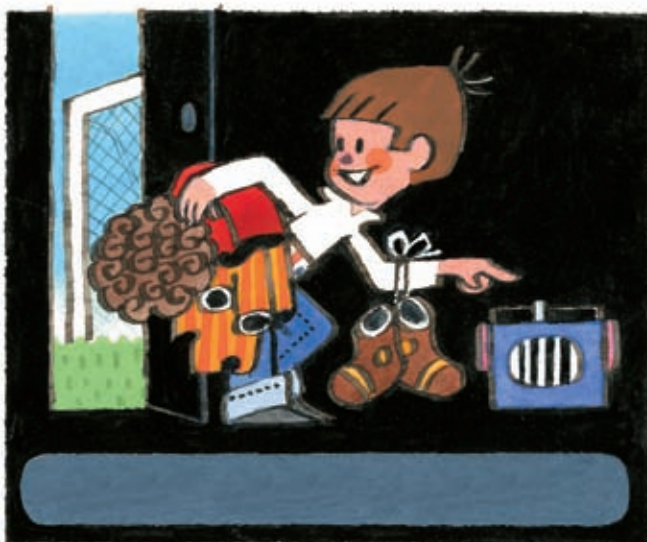
3 Musíš nám píchnout, Miki.