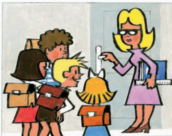
6 Milé děti, dnes si povíme něco o zvířátkách.