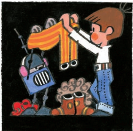
4 Splním každé vaše přání, pane můj.