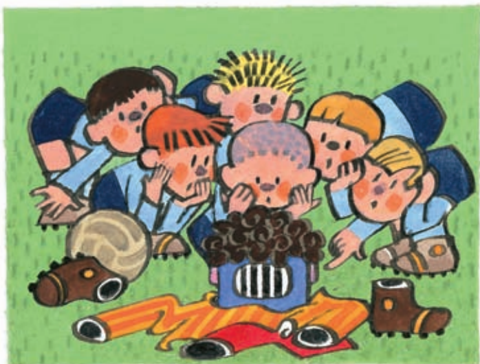
8 To se jim to vyrovnávalo...