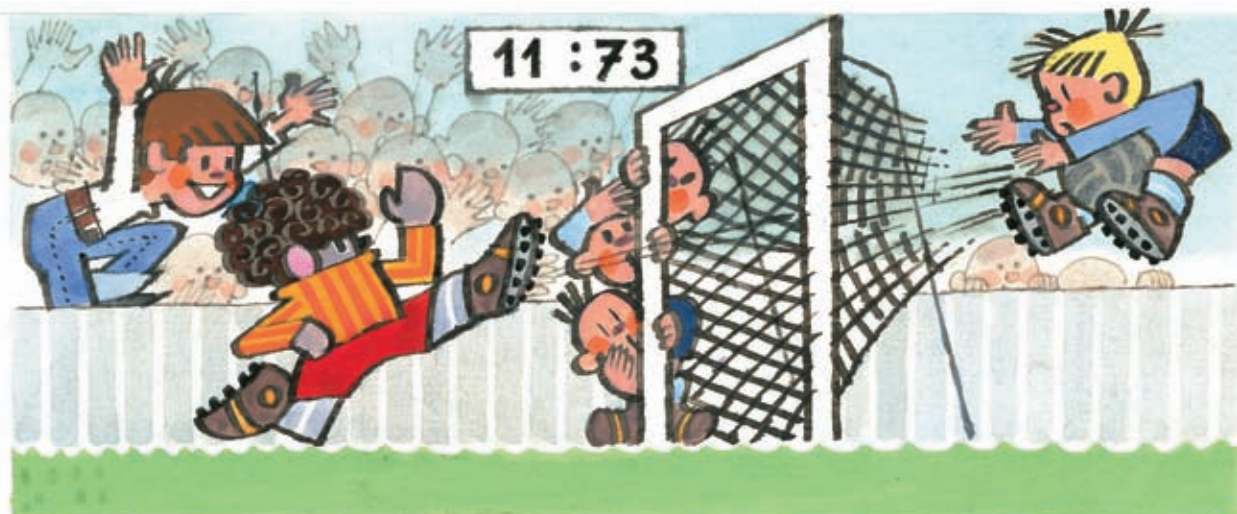
6 Miki válí!!