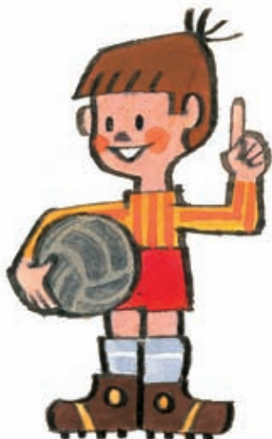
2 To se ještě uvidí!