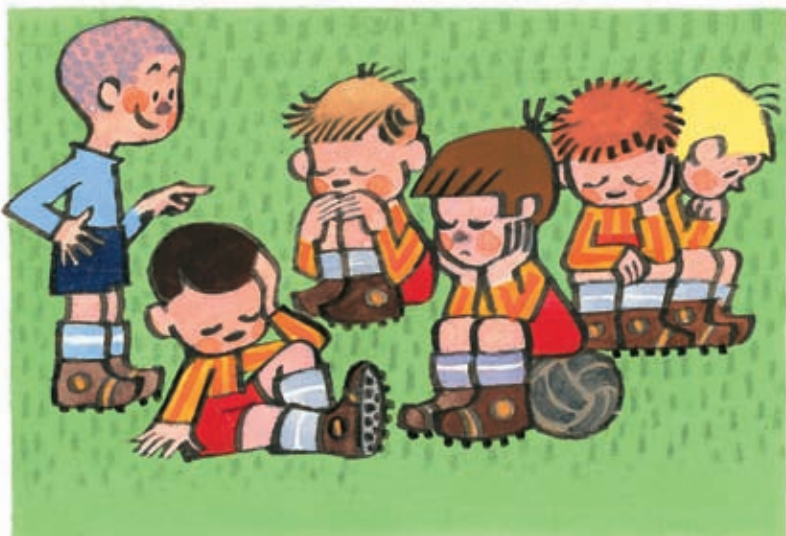
1 Už nevyrovnáte, kamarádíčkové!