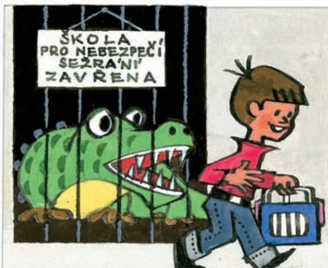
8 Miki, jsi jednička.