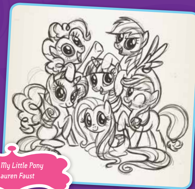
Kresba My Little Pony od Lauren Faust

Dítě je v každém z nás. A není tak těžké ho najít. Stačí se jen otevřít síle kouzel.