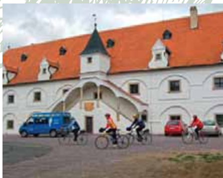
Vodní mlýn ve Slupi

Slup, dříve zvanou i Čule, německy Zulp, zdobí unikátní technická památka Vodní mlýn na Mlýnské strouze. Ve mlýně je instalována expozice vývoje mlynářství včetně provozuschopného mlýnského zařízení, jež je uváděno v činnost vodními koly. Mlýnská strouha je technickým dílem ze 13. st., které přivádělo vodu nejen do mlýnů ale i do soustavy Jaroslavických rybníků. Celková délka náhonu je 29 kilometrů, šířka 12–15 metrů, průtok 2–3 metry za vteřinu. Pozdně gotický kostel Jména Panny Marie je z 13. st., od počátku 17. st. se zde konají poutě u „Panny Marie pod