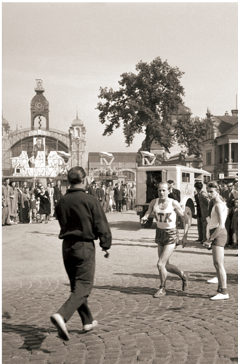
Emil Zátopek reprezentoval Armádní tělovýchovný klub v běžecké štafetě, kterou sjednocená tělovýchova zdravila IX. sjezd KSČ (prostranství před pražským Průmyslovým palácem 29. 5. 1949;)