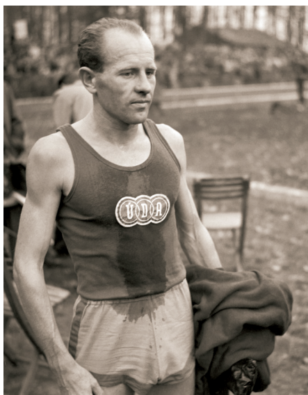
Houštka 1. 11. 1953: Emil Zátopek dosáhl světového rekordu na 10 kilometrů