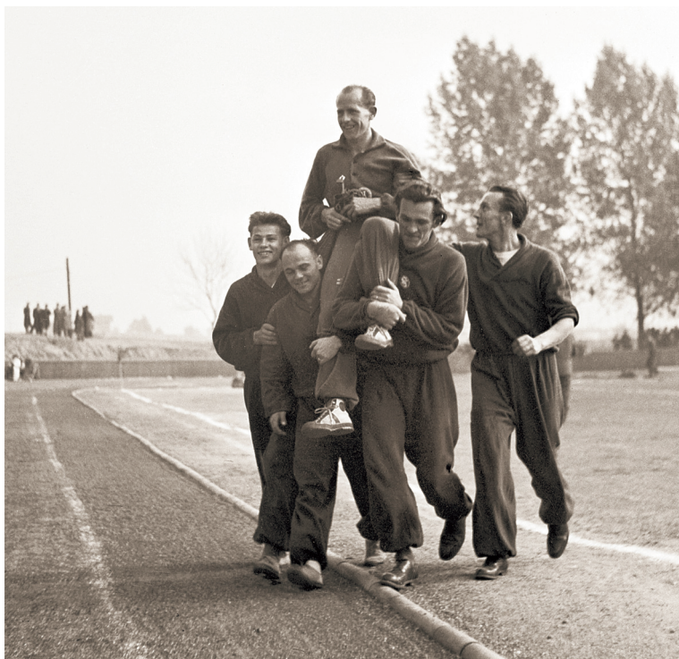
Sportovci nesou Emila Zátopka na „stupních vítězů“ (Stadion obránců míru v západočeském Chodově 22. 10. 1951;)