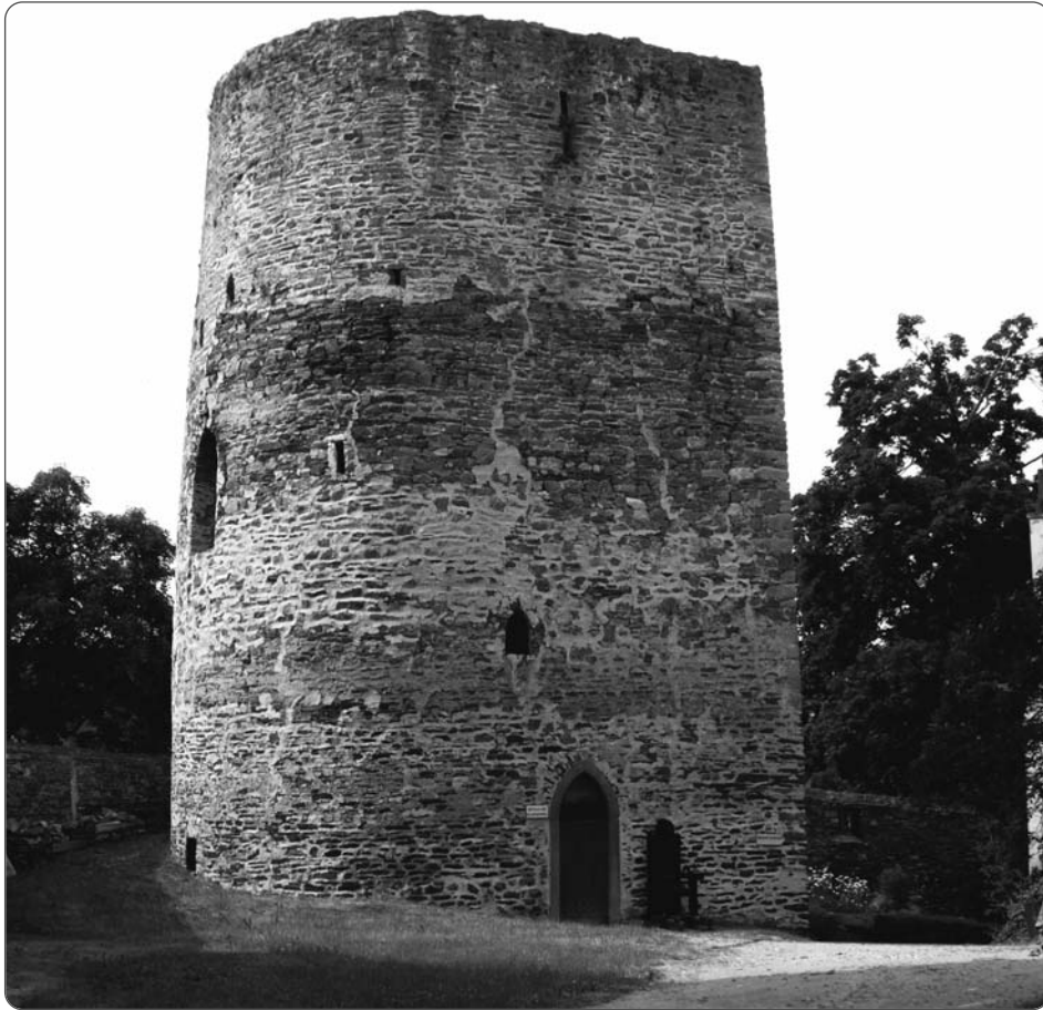
Bítovská věž v pokojných dobách sloužila jako vězení; mučící křeslo u vchodu je součástí naučné expozice