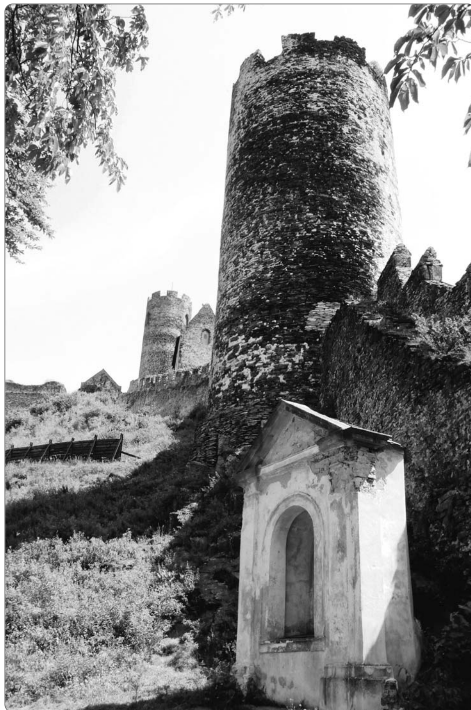
Hradby Bezdězu a kaple křížové cesty

Někdejší královský hrad Bezděz se stal součástí církevních statků. Když na konci osmnáctého století císař Josef II. (1741–1790) zrušil pražský Emauzský klášter, došlo i ke zrušení kláštera na Bezdězu. Lidé žijící v okolí