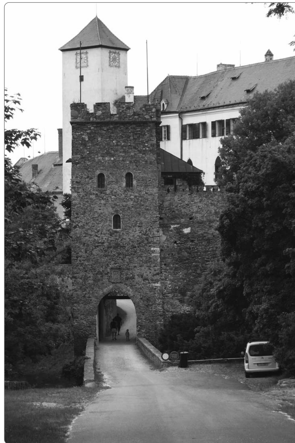
Vstupní brána na hrad Bítov

Poslední člen rodu Jindřich Bítovský z Lichtenburka držel hrad až do své smrti v roce 1572 a jím tento významný moravský šlechtický rod vymřel