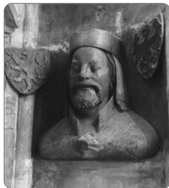
Karel IV., triforium Svatovítské katedrály (po roce 1370)

Nedbat na právní předpisy nebylo myslitelné tam, kde byly s manželstvím spojeny závažné majetkové zájmy, nebo dokonce zájmy státněpolitické, jak tomu bylo právě v panovnických rodinách. Ty musely bedlivě sledovat, aby