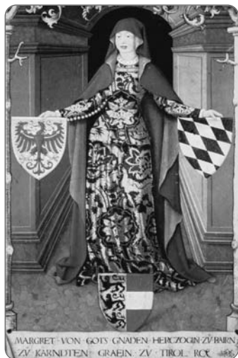
Markéta Korutanská řečená Maultasch (1318–1369), deskový obraz z poloviny 16. století

Rozhodnutí o neplatnosti bylo výsledkem zdouhavého soudního řízení a na něm založeném právním výroku papeže. Čekání na výsledek znemožňovalo pokračování manželství a oddalovalo možnost uzavřít manželství jiné. To je případ Karlova bratra Jana Jindřicha a Markéty Korutanské zvané Maultasch.