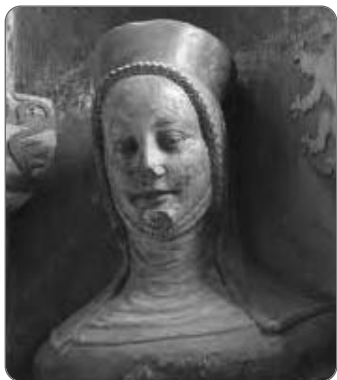
Eliška Přemyslovna, triforium Svatovítské katedrály (po roce 1370)