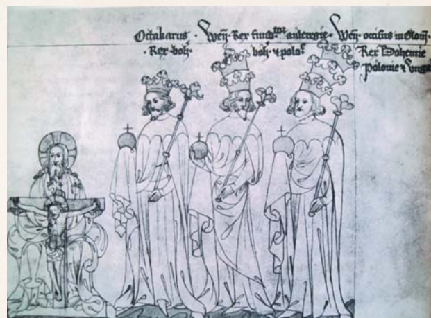
▲ Poslední Přemyslovci (Přemysl Otakar II., Václav II., Václav III.) v rukopise Zbraslavské kroniky

Václav II., ač měl krušné dětství spojené i s vězněním na Bezdězu, se jako král stal jedním z nejmocnějších v Evropě. Opatrnou, ale promyšlenou politikou po boku silného rodu Habsburků – na římském trůně seděli postupně otec a bratr jeho ženy Guty – dokázal království zotavit po sérii válek a hladomorů, bohatství mu přinesla nově objevená ložiska stříbra u Kutné Hory. Pro ni Václav vydal horní (= hornický) zákoník a od roku 1300 začal razit nové peníze, pražské groše. A ačkoli se nikdy nenaučil číst, dokonce skládal milostné básně. Roku 1300 s rukou druhé ženy Elišky Rejčky získal i nárok na Polsko, kdy byl také korunován. Pro svého syna Václava III. se pokoušel, se střídavými úspěchy,