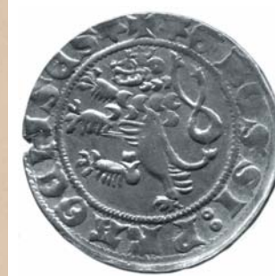
▲ Pražský groš Václava II.