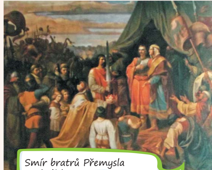
Smír bratrů Přemysla a Vladislava r. 1197, obraz Josefa M. Trenkwalda

Přecházel mezi jednou (Filip Štaufský) i druhou (Ota Brunšvický) stranou, a to tak dokonale, že již roku 1198 dostal královský titul – jako třetí český vládce, po Vratislavu I. (korunován 1085) a Vladislavu I. (1158) – a oba uchazeči o císařskou korunu mu ho potvrdili.