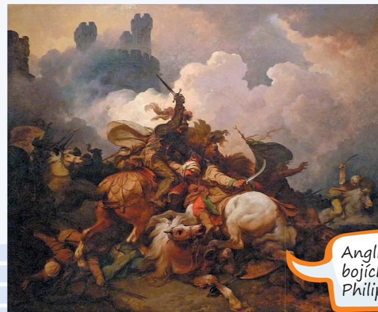
Anglický král Richard I. při bojích ve Svaté zemi, obraz Philipa de Louthbourga