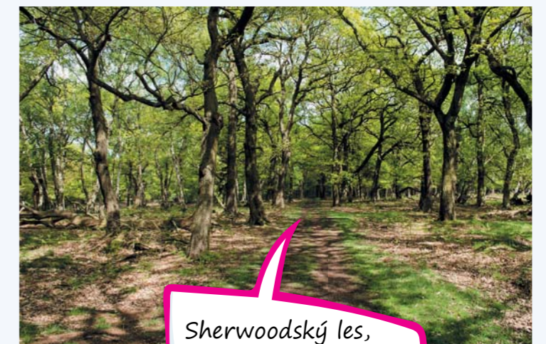
Sherwoodský les, spojený s pověstmi o Robinu Hoodovi

Do Richardovy doby je kladen i jeden z neznámějších anglických příběhů – legenda o Robinu Hoodovi: neohrožený bojovník a hrdý lukostřelec prý žil v Sherwoodském lese u Nottinghamu a jako všichni zbojníci bohatým bral a chudým dával. Ve skutečnosti se ale jmenoval William, nežil na severu Anglie, ale poblíž Londýna a vracel kořist ukradenou žoldněři v královských službách. Robina, jak ho známe my, vytvořil až spisovatel Walter Scott na počátku 19. století.