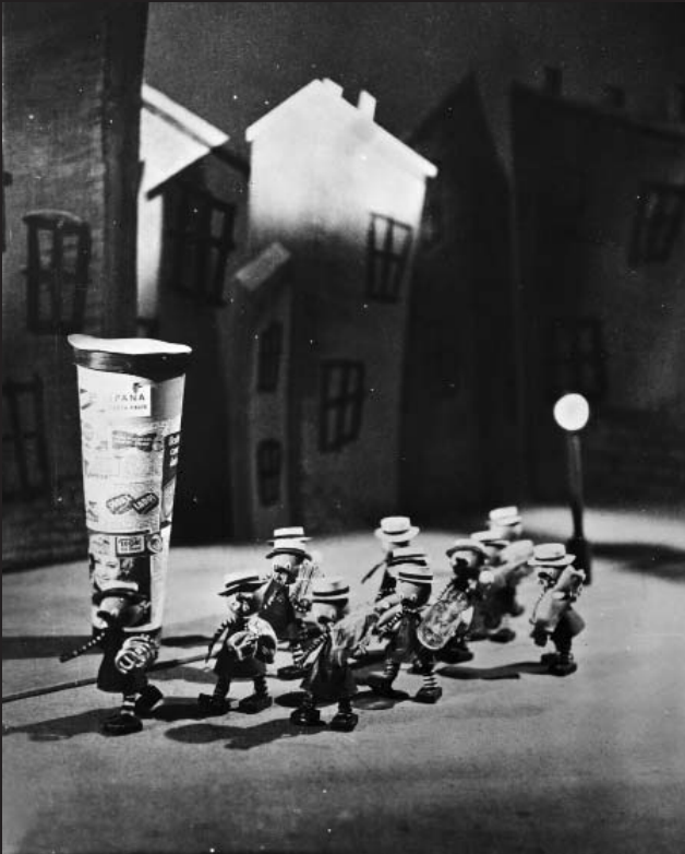
Podkova pro štěstí (1946)