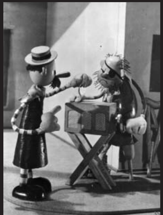
Prokouk filmuje (1948)