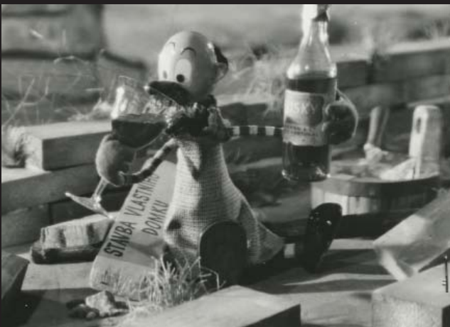
Prokouk v pokušení (1947)