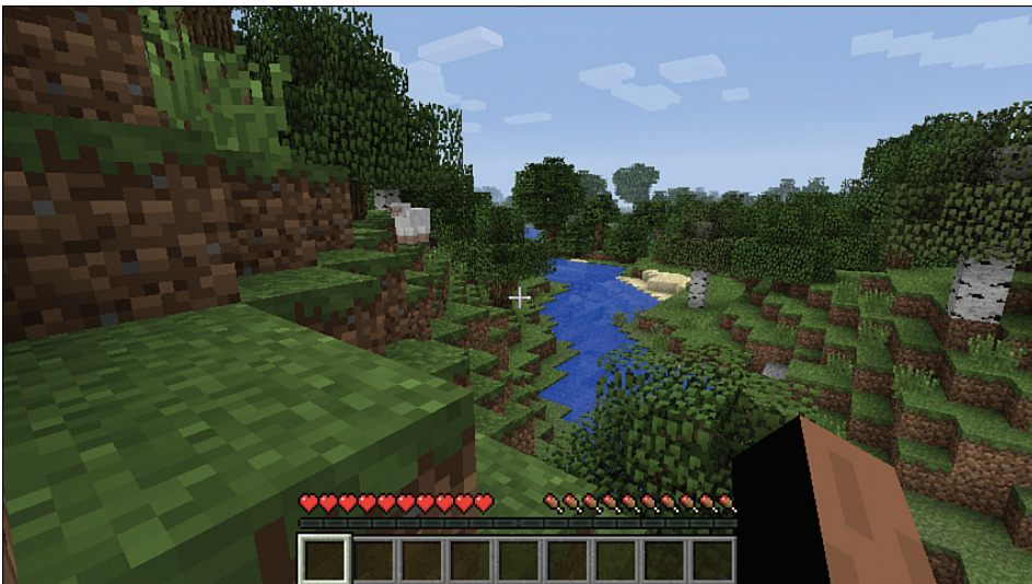
OBRAZEK 2.1: Mé zelené údolí: stromy, kopce a pěkná řeka; a hra na „hledání ovce“

Začněte tím, že se vydáte ke stromům. Protože jich potřebujete několik, poohlédněte se po nějaké skupince. Pomocí myši nastavujete směr a pomocí klávesy W jdete dopředu, A a D slouží k pohybu doleva a doprava a klávesou S couváte. Ve většině biomů nějaké stromy jsou, takže by neměly být příliš daleko, a pokud jste se ocitli v džungli, lese nebo tajze, stromů bude kolem vás habaděj. Na obrázku 2.1 je vidět místo zrození v říčním biomu. V zájmu maximálního možného využití toho, co máte k dispozici, použijte tento svět, kterému jsem dal přezdívku Elysium , na připomínku stejnojmenné knihy. Je ale možné, že takové štěstí mít nebudete. Některé biomy, například poušť, žádné stromy nemají. Pokud se tedy ocitnete na takovém místě, vydejte se k nejbližšímu vrcholku a z jeho vrcholu se rozhlédněte po krajině. Při zdolávání výškových rozdílů ťukněte s přidrženu klávesou W na mezerník, čímž vyskočíte na blok před vámi. Pokud v dálce zahlédnete nějaké stromy, spěšte si – běží vám totiž čas a za chvíli začne noc!