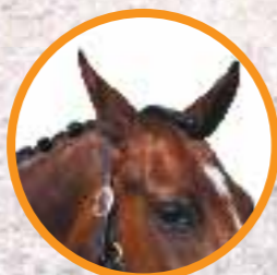
Tento kůň poslouchá a je v klidu.