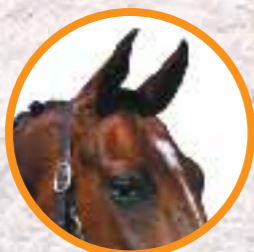
Tenhle kůň je ve střehu a pozorně vnímá okolí.