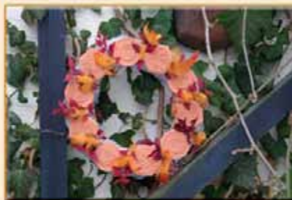
Věnc na dveře