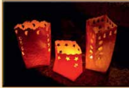
Lampionky do zahrady