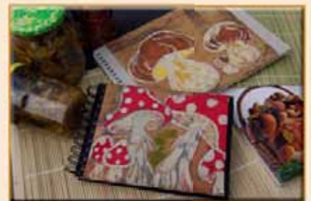
Muchomůrky voskovou batikou