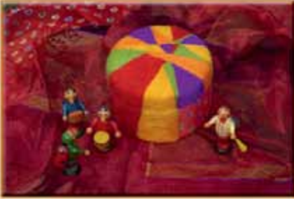
Plstění jehlou na polystyrenové formě