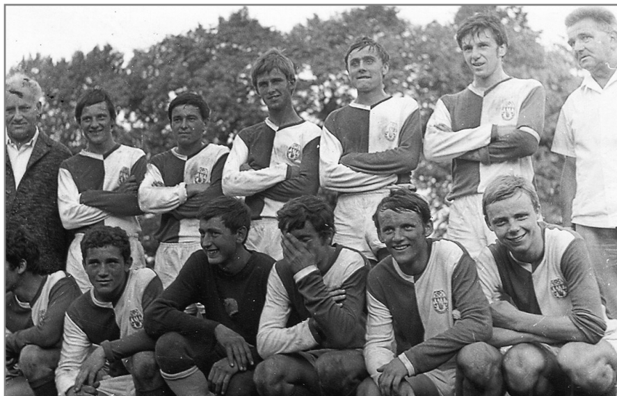
Po utkání o postup do dorostenecké ligy v roce 1968 [nahore druhý zprava]