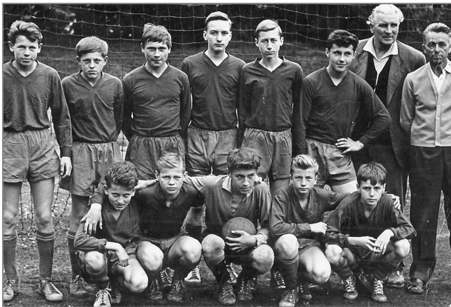
V Kroměříži v roce 1962 [dole první zprava]

v Kroměříži zažil historický postup do první ligy dorostu. Chvilí jsem tam ještě hrál, ale krátce nato mě přeřadili do A týmu k mužům. Za ně jsem odehrál asi šest zápasů, protože to už byl říjen 1969, nastoupil jsem do Prahy na vysokou školu a současně odešel do Sparty.