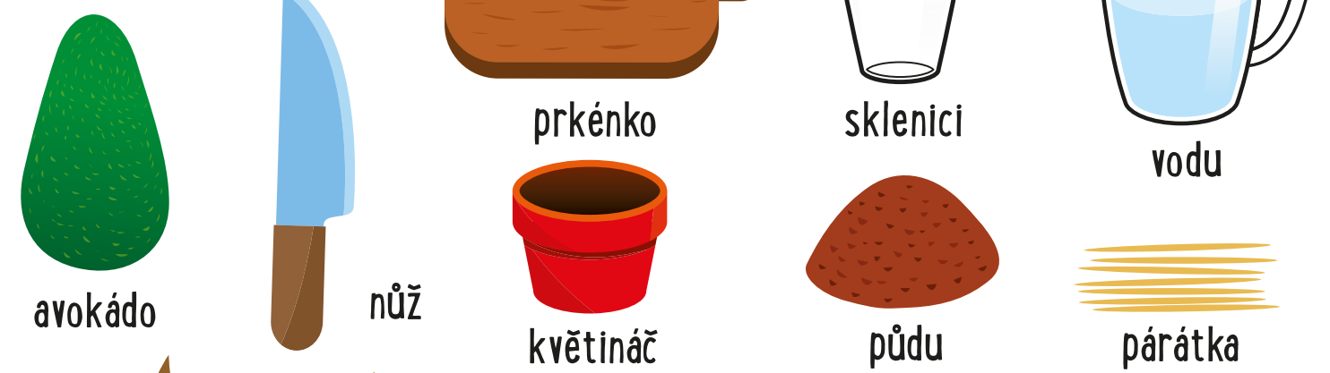
avokádo nůž prkénko sklenici vodu květináč půdu párátka