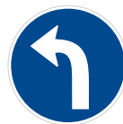
Příkazovaný směr jízdy vlevo (C 2c)