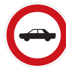
Zákaz vjezdu osobních automobilů (B 3b)