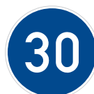
Nejnižší dovolená rychlost (C 6a)