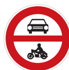
Zákaz vjezdu všech motorových vozidel (B 11)