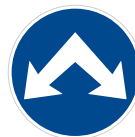
Příkázaný směr objíždění vpravo a vlevo (C 4c)