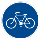
Stežka pro cyklisty (C 8a)