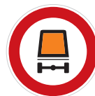
Zákaz vjezdu vozidel přepravujících nebezpečný náklad (B 18)