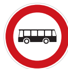
Zákaz vjezdu autobusů (B 5)