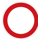
Zákaz vjezdu všech vozidel (v obou směrech) (B 1)