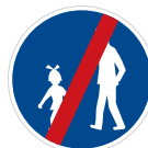
Konec stezky pro chodce (C 7b)