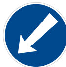
Příkázaný směr objíždění vlevo (C 4b)