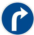
Příkazovaný směr jízdy vpravo (C 2b)