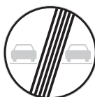
Konec zákazu předjíždění (B 21b)