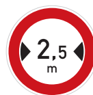
Zákaz vjezdu vozidel, jejichž šířka přesahuje vyznačenou mez (B 15)