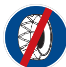
Sněhové řetězy – konec (C 5b)