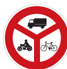
Zákaz vjezdu vyznačených vozidel (B 12)