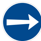
Příkázaný směr jízdy zde vpravo (C 3a)