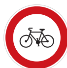
Zákaz vjezdu jízdních kol (B 8)