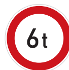
Zákaz vjezdu vozidel, jejichž okamžitá hmotnost přesahuje vyznačenou mez (B 13)