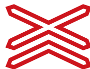
Výstražný kříž pro železniční přejezd vícekolejný (A 32b)