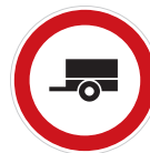
Zákaz vjezdu motorových vozidel s přívěsem (B 33)