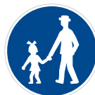
Stežka pro chodce (C 7a)