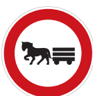
Zákaz vjezdu potahových vozidel (B 9)