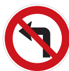
Zákaz odbočování vlevo (B 24b)