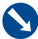
Příkázaný směr objíždění vpravo (C 4a)