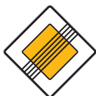
Konec hlavní pozemní komunikace (P 3)