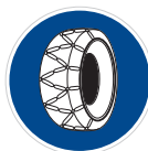
Sněhové řetězy (C 5a)