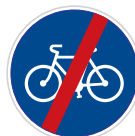
Konec stezky pro cyklisty (C 8b)