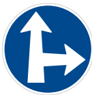
Příkazovaný směr jízdy přímo a vpravo (C 2d)