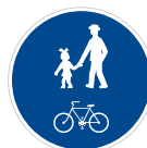
Stežka pro chodce a cyklisty (C 9a)