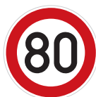
Nejvyšší dovolená rychlost (B 20a)