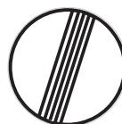
Konec všech zákazů (B 26)