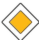
Hlavní pozemní komunikace (P 2)