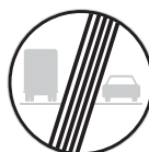
Konec zákazu předjíždění pro nákladní automobily (B 22b)