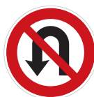
Zákaz otáčení (B 25)