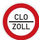
Povinnost zastavit vozidlo (B 27)