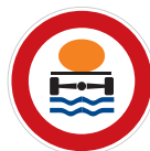
Zákaz vjezdu vozidel přepravujících náklad, který může způsobit znečištění vody (B 19)