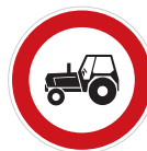
Zákaz vjezdu traktorů (B 6)