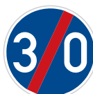
Konec nejnižší dovolené rychlosti (C 6b)