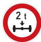
Zákaz vjezdu vozidel, jejichž okamžitá hmotnost připadající na nápravu přesahuje vyznačenou mez (B 14)