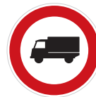
Zákaz vjezdu nákladních automobilů (B 4)