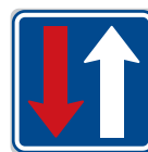
Přednost před protijedoucími vozidly (P 8)