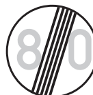
Konec nejvyšší dovolené rychlosti (B 20b)