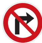
Zákaz odbočování vpravo (B 24a)