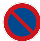
Zákaz stání (B 29)