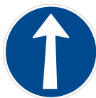
Příkazovaný směr jízdy přímo (C 2a)