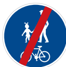
Konec stezky pro chodce a cyklisty (C 9b)