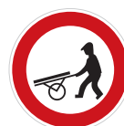
Zákaz vjezdu ručních vozíků (B 10)