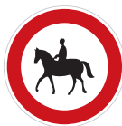
Zákaz vjezdu pro jezdce na zvířeti (B 31)