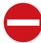
Zákaz vjezdu všech vozidel (B 2)