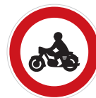
Zákaz vjezdu motocyklů (B 7)