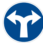
Příkazovaný směr jízdy vpravo a vlevo (C 2f)