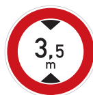
Zákaz vjezdu vozidel, jejichž výška přesahuje vyznačenou mez (B 16)