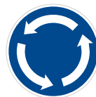
Kruhový objezd (C 1)