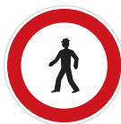
Zákaz vstupu chodců (B 30)