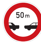
Nejmenší vzdálenost mezi vozidly (B 34)