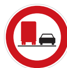
Zákaz předjíždění pro nákladní automobily (B 22a)