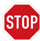
Stůj, dej přednost v jízdě! (P 6)