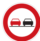
Zákaz předjíždění (B 21a)