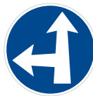
Příkazovaný směr jízdy přímo a vlevo (C 2e)