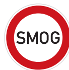
Jiný zákaz (B 32)