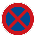
Zákaz zastavení (B 28)