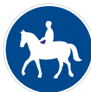
Stežka pro jezdce na zvířeti (C 11a)