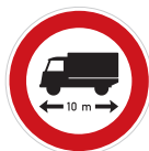
Zákaz vjezdu vozidel nebo souprav vozidel, jejichž délka přesahuje vyznačenou mez (B 17)