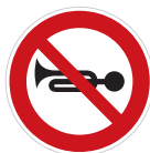
Zákaz zvukových výstražných znamení (B 23a)