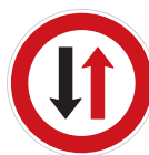
Přednost protijedoucích vozidel (P 7)