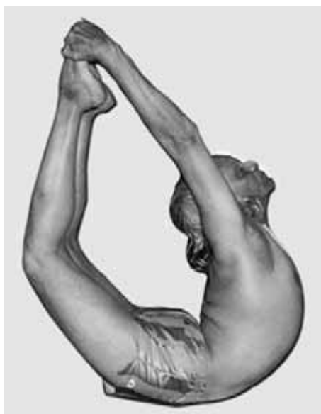
Belur Krischnamatchar Sundararaja Iyengar

Když vysvětluje své úzké zaměření na tělesné praktikování, odkazuje Iyengar na Kathopaníšádu , jednu z Upaníšád napsanou kolem roku 300 před Kristem, jež přirovnává tělo k vozu, smysly ke koním, kteří vůz táhnou, mysl k otěžím, intelekt k vozkovi a duši k samotnému pánovi vozu. Aby se vůz pohyboval vpřed, musí vše spolu harmonicky fungovat. Ačkoli mnoho jógových přístupů zatracuje tělo, Iyengar (2001, 16) se hlásí věrně ke všem osmi stupňům Pataňdžalioho ashtanga jógy , včetně ásan. Spíše než přístup „jedna velikost sedí všem“ zdůrazňuje, že „při provádění ásan se snaží vyhovět individuálním potřebám jednotlivce s ohledem na jeho konstituci a tělesnou kondici. Překračuje koncept „pozice“, Iyengar (2001, 17) zdůrazňuje, že „ásany dosahujeme tehdy, umístíme-li korektně všechny části těla s plným vědomím