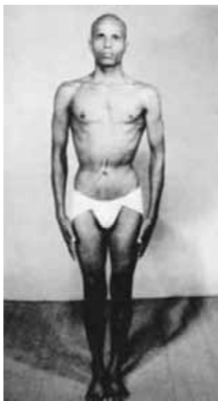
K. Pattabhi Jois

Význam slova ashtanga často navozuje otázky. Pojem znamená „osm stupňů“, jak je zmíněno v Pataňdžaliovi cestě, popisované v Jóga Sútrách. Zároveň je to ale název populárního směru jógy praktikovaného dnes po celém světě, který z indického Mysore přinesl na západ Pattabhi Jois . Celým názvem Ashtanga Vinyasa jóga následuje Joiovo učení, pevně zakotvené v Jóga Sútrách. Původ této metody je trochu matoucí. Je nám sdělováno, že se jedná o starodávný systém popsany mudrcem Vamanou Rishim v díle Yoga Korunta , jednom z mnoha textů, o kterých se tvrdí, že byly předávány ústně Tirumalai Krischnamacharyovi na počátku dvacátého století jeho učitelem Ramou Mohanem Brahmachari . Yoga Korunta údajně obsahuje seznam ásan uskupených do sestav, jež dnes tvoří šest „sérií“ Ashtanga Vinyasy , kde je přesně dané pořadí jednotlivých pozic spolu s původním učením vinyasy , dristi , bandh , muder a filozofie . Poté, co se od Brahmachariho dověděl, že původní text je k nalezení v knihovně Calcutta Central Library , údajně strávil Krischnamacharya ve dvacátých letech devatenáctého století celý rok studiem Korunta a přepisováním toho, co bylo v originále poškozeno. Jois říká, že to bylo pramenem pro vznik systému, který od Krischnamacharyi převzal. Verze, kterou předložil Jois , byla prvně publikována v roce 1962 jako Yoga Mala ( Jois 2002).