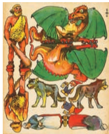
Divadelní loutky • 34,1 x 41,9 cm • 1936