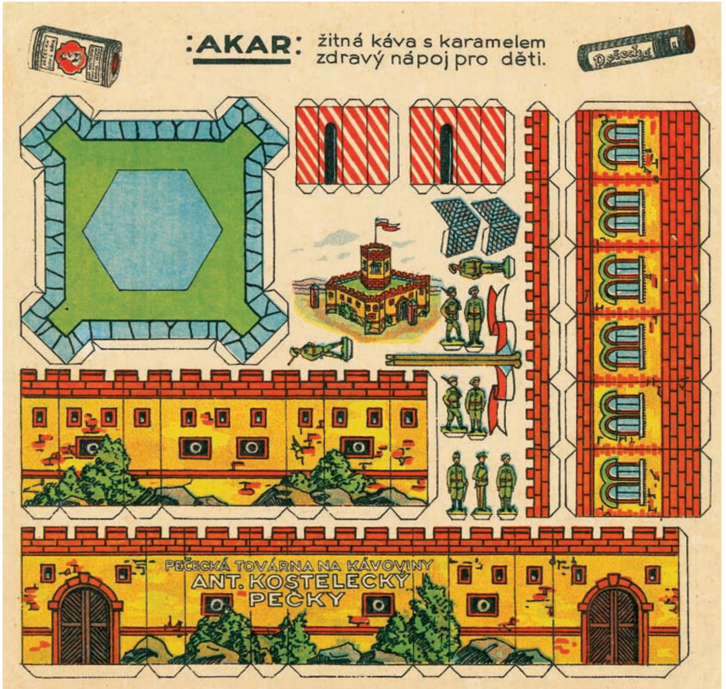
Pevnost • reklamní vystřihovánka • 16,8 x 16 cm • vydal Antonín Kostecký, Pečekká továrna na kávoviny, Pečky • 30. léta 20. století