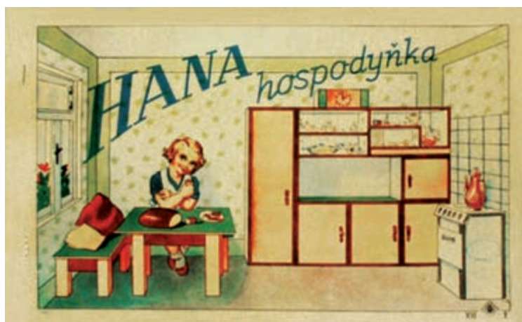
Hana hospodyňka • 55 x 34 cm • 30. léta 20. století

Brouk je neoficiální ale zažitý název pražského vydavatelství Josefa Chrousta. Ochrannou známku tvořil obrázek brouka (chrousta) ve čtverci, někdy v kosočtverci. Působilo ve třicátých a čtyřicátých letech 20. století. Z jeho bohaté produkce známe několikero archů vystřihovacích betlémů, archy vojáků různých armád, archy zvířat, vystřihovací kulisy k loutkovým divadlům (1936) a modely staveb a techniky. Autorem vystřihovacích vojáků i loutkového divadla byl známý malíř Ludvík Antonín Salač. Jednotlivé listy měly různé velikosti, někdy tvořily i dvojlisty (betlémy, figurky vojáků). Vzácné jsou dochované komplety betlémů vydaných jako soubor v deskách nebo sešitová vydání oblékacích panenek. Vzhledem k množství produkce byly jednotlivé archy označeny podle typu vystřihovánky římskou číslicí doplněnou