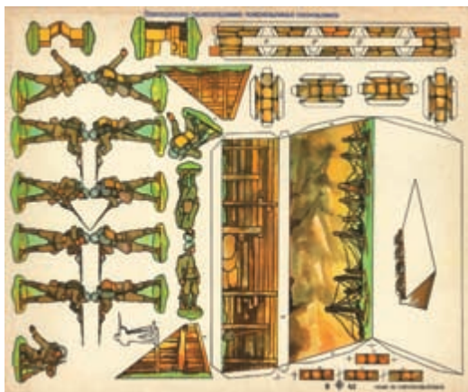
Československá armáda • 41,5 x 34,5 cm • 30. léta 20. století