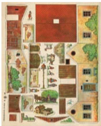
Statek • 42,7 x 34,4 cm • 30. léta 20. století

pomáhají rozlišovat i jednotlivá různá vydání vzhledem k nemalému množství dotisků.