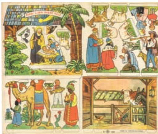
Betlém • 42 x 35 cm • 30. léta 20. století