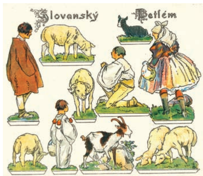
Slovenský betlém • 2 listy • 18,2 x 20,4 cm • 1919