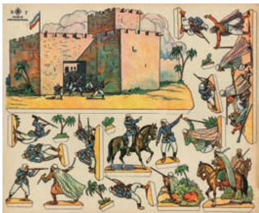
Boj o pevnost • 42,2 x 34,3 cm • 30. léta 20. století