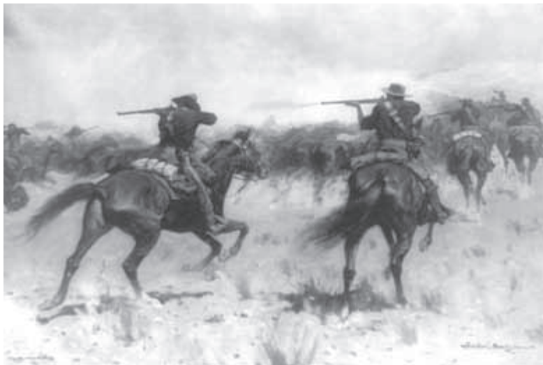
Ochránci stáda od Frederica Remingtona. Winchesterovky představovaly standardní výzbroj kovbojů i rančérů

bým krytem. Místo toho se opakovačka v poslední čtvrtině 19. století stala víceúčelovou „pracovní“ puškou pro tisíce kovbojů, rančérů, mužů zákona a farmářů.