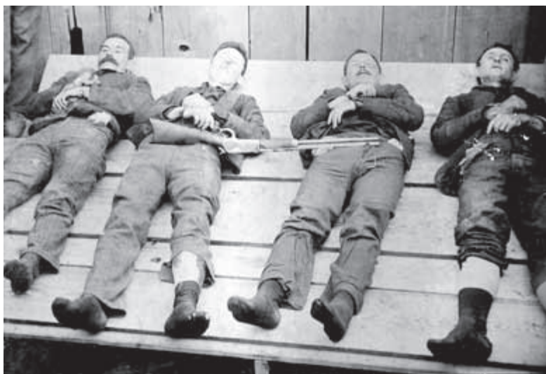
Daltonova banda pózující s winchestrovkou

Rozvášněný dav se zasmál a vrátil se civět na čtyři lupiče, kteří neměli takové štěstí, aby se dostali do ordinace živí.