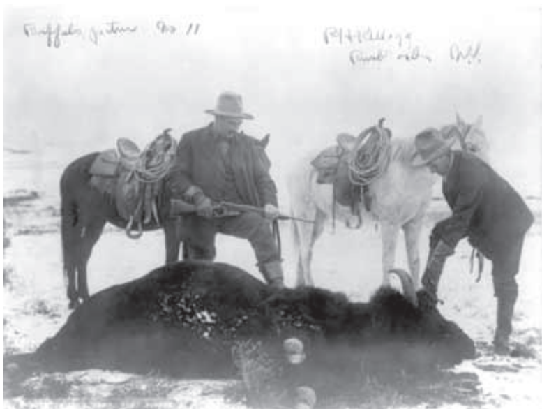
Lovec bizonů se svou puškou Winchester vzor 1895

obou Dakotách, Montaně a Wyomingu, kde díky nim indiáni ze severních Plání odolávali náporu bílých. Tato zbývající velká loviště bizonů se měla stát jevištěm několika posledních dějství válek s indiány. Zůstává ironií osudu, že to nakonec byly právě domorodé indiánské kmeny, jež sklidily plody inovací na poli amerických palných zbraní, a to při nejslavnější konfrontaci této závěrečné hry: Custerově poslední obraně.