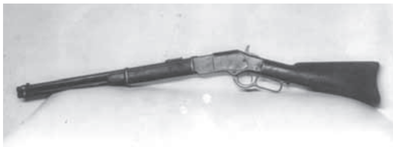
Winchestrovka Jesseho Jamese

Nešlo však o žádnou akci na podporu prodeje. Důvod rozdávání zbraní byl totiž jasný každému odvážlivci, který nahlédl do okna vedlejší budovy: v místní bance právě probíhala loupež. Přesněji řečeno, lupiči byli ve dvou bankách současně a pět plně ozbrojených mužů mířilo na vyděšené klienty a zaměstnance uvnitř První národní banky a Condonovy banky přímo uprostřed města. Nechvalně proslulá Daltonova banda sem totiž zavítala, aby ve zmíněných finančních ústavech provedla malý neoprávněný výběr peněz.