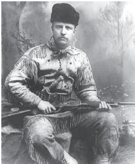
Ted Roosevelt na fotografii z roku 1895 se svou oblíbenou puškou: Winchester vzor 1876 verze Deluxe

Na Západě našel Roosevelt důvod, proč jít dál. Inspirací se mu stal lov. Jakmile došlo na pušky a pistole, stával se z něj kovbojský básník. „Nikdo s výjimkou těch, kdo toho byli účastni, nemůže pochopit báječný požitek, který přináší lov v liduprázdné krajině,“ napsal Roosevelt. „Pro takového člověka existuje radost z dobře vedeného koně a dobře držené pušky. Pro něj existují ty dlouhé dny naplněné lopotou a strážní, jimž pevně čelí a jež nakonec korunuje kýžený triumf. I v pozdějších letech si navždy uchová v paměti vzpomínky na nekonečné prerie tetelící se v jasném slunci, na rozlehlé, sněhem oděné pustiny, ležící neobydlené pod šedou oblohou, na zádumčivé mokřiny, chvatný proud mocných řek, dech letního lesa, jež nikdy