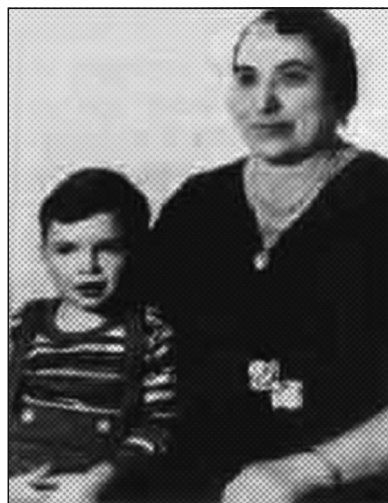
Malý Al Capone se svou matkou

Their first child who was conceived and born in the New World was their fourth son Alphonse. He was born on January 17th, 1899.