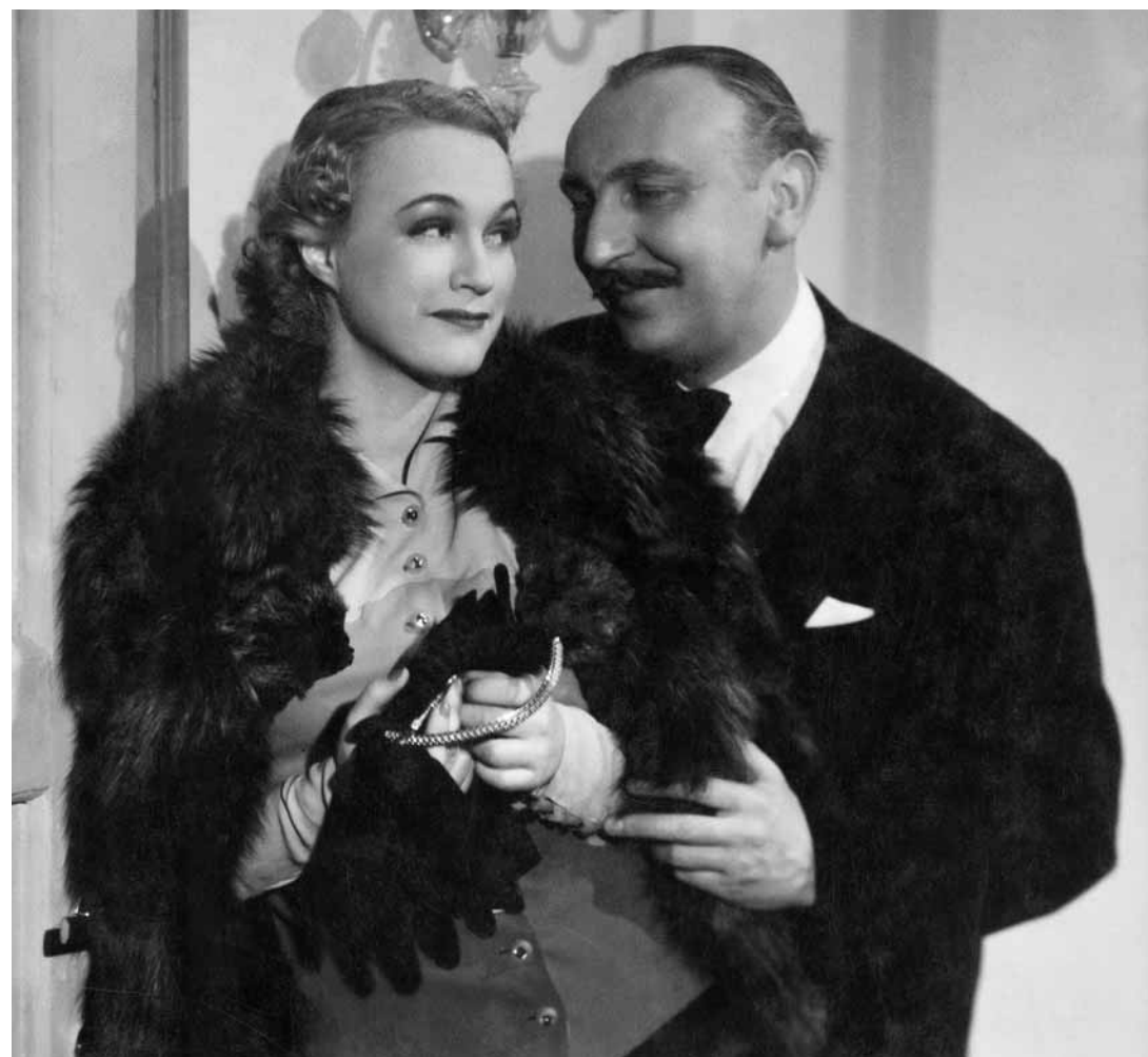
Adina Mandlová, Čeněk Šlégl; U POKLADNY STÁL (1939)

Poté, co jsem v minulé knize napsal, že není známo místo, kde je pohřbena Adina Mandlová , dostal jsem celou řadu „zaručených“ informací. Začal jsem je prověřovat a ukázalo se, že jedna je skutečně pravdivá. Někteří z vás mi napsali, že místem jejího posledního odpočinku je Blatná na Strakonicku. To mi potvrdili i v místní pohřební službě: „ Ano, paní Mandlová sem byla převezena z příbramské nemocnice. 18. června 1991 proběhla tady v Blatné kremace a 18. července 1991 byl proveden rozptyl jejích ostatků na místní rozptylové loučce. “ Dozvěděl jsem se, že zesnulí z Příbrami byli tenkrát opravdu odváženi právě sem, neboť Příbram nemá vlastní krematorium. Zjistil jsem i to, že rozptyl proběhl tzv. „bez účasti“, čili přítomen nebyl nikdo. Přála si to tak sama Adina? To už se nikdy nedozvíme. Každopádně místo, kam za ní můžeme zajet, už jsme odhalili – Blatná, okres Strakonice. Málo známý portrét je z roku 1942.