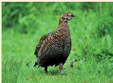
Samička je zřetelně menší a má světlé peří.

V období od konce dubna do června naklade samička sedm až deset vajec a sedí na nich přibližně 25 až 27 dní. Hnízdo tvoří jamka v zemi.