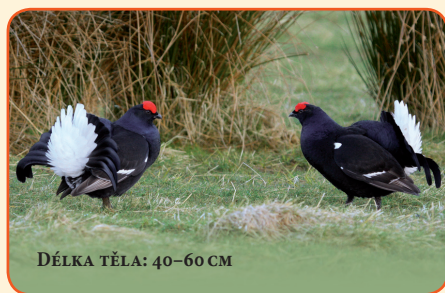
DĚLKA TĚLA: 40–60 CM

Tetřívěk obecný se u nás vyskytuje ve významnějších počtech pouze v pohraničních pohořích, stabilní populace žijí v Krušných a Jizerských horách a Krkonoších. Na Šumavě se stavy tetřívka dlouhodobě snižují, v Novohradských horách dnes žije pouze zbytková populace. Jeho domovem jsou močály, vřesoviště a světlé lesy.