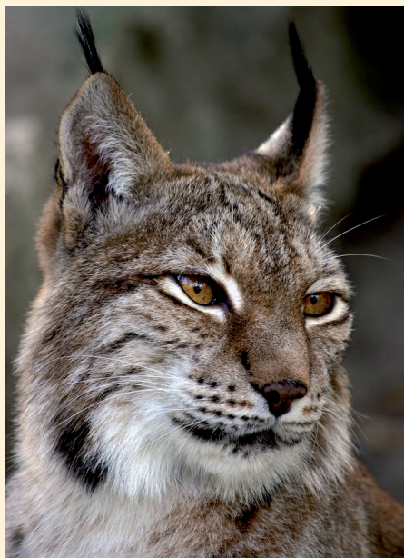
Vidíte dlouhé „štětičky“ na uších?