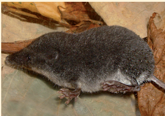
Rejsec černého poznáte podle dlouhého špičatého čumáčku.

Samička může mít mladé až třikrát do roka. V jednom vrhu přitom bývá většinou tři až šest myšek.