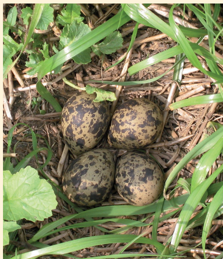
Hnízdo čejky chocholaté

naté krajiny. Potkáte je na podmáčených loukách, polích, pastvinách, v močálech a u vody. Kvůli intenzivnímu zemědělství se bohužel zmenšuje jeho životní prostor. Z některých oblastí čejky prakticky vymizely a její stavy se snížily i na tradičních hnízdištích v jižních a východních Čechách nebo na jižní Moravě. V současnosti tento pták není uveden v Červené knize ČR.