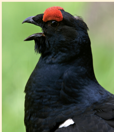
Samce poznáte podle nápadné červené skvrny nad okem, která se označuje jako „pouška“.