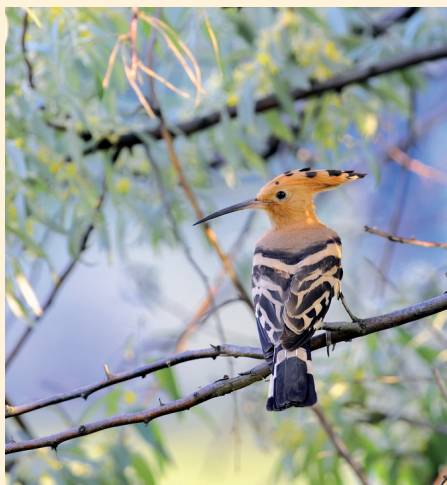
Dudek chocholatý má černobíle pruhovaná křídla a ocas.

V současné době u nás hnízdí jen ojediněle a nepravidelně, hlavně v nížinách a pahorkatinách, častěji pouze na jižní Moravě na Hodonínsku, Břeclavsku a Znojemsku. V zimě dudek odlétá na jih.