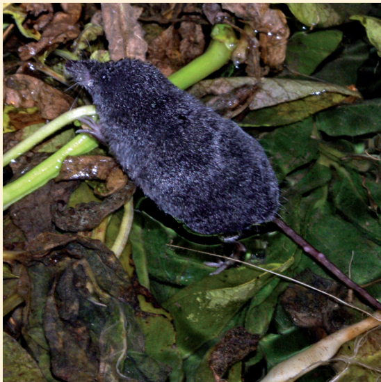
Rejsec černý je rád ve vodě i u vody.

území, především v pahorkatinách, vrchovinách a podhorských oblastech. V současnosti není uveden v Červené knize ČR.