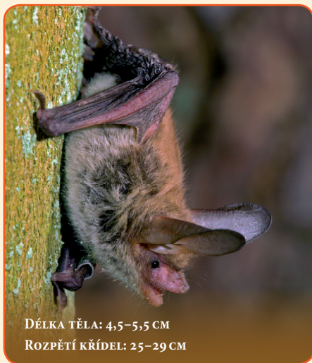
DÉLKA TĚLA: 4,5–5,5 CM ROZPĚTÍ KŘÍDEL: 25–29 CM

Stejně jako kolibřík nebo poštolka ovládá i netopýr velkouchý třepotavý let. Přitom pohybuje křídly ve vzduchu a vznáší se na místě.