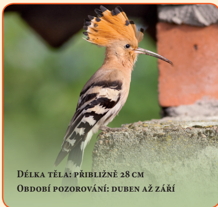
DĚLKA TĚLA: PŘIBLIŽNĚ 28 CM OBDOBÍ POZOROVÁNÍ: DUBEN AŽ ZÁŘÍ

Svá hnízda staví dudek chocholatý nejraději v dutinách stromů. Tam sedí asi tři týdny na vejcích a další čtyři týdny vychovává mláďata.