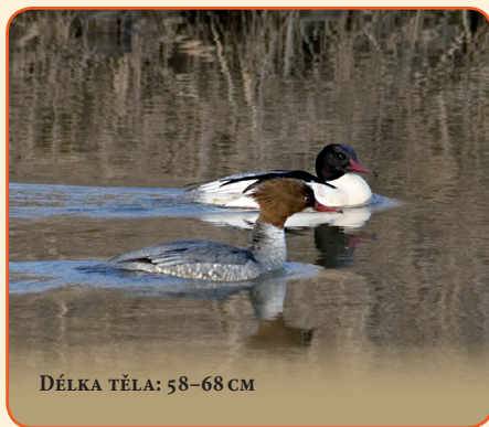
DÉLKA TĚLA: 58–68 CM