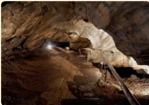
▲ Chodba Slavníkovců v nejnižší položené partii jeskyně.