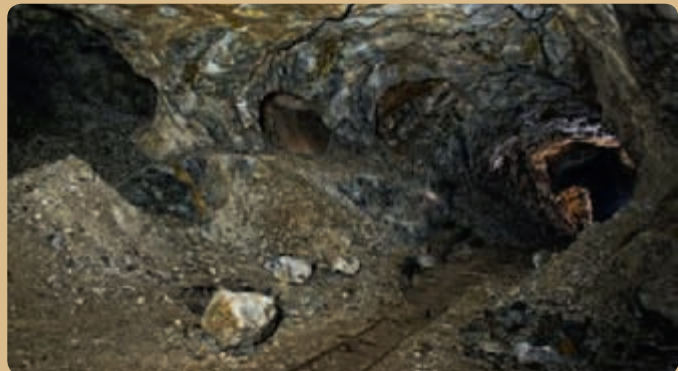
▲ Vápencové ložisko Lorety je protkáno kombinací důlních stol a menších krasových dutin.