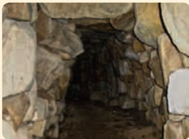
▲ Grotta je přístupná, ale v dosti zchátralém stavu.