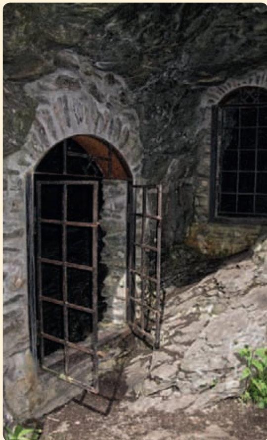
▲ Podél naučné stezky budete mít řadu vstupů do podzemí. Štoly jsou uzamčené a vstup do nich není dovolen, dá se do nich ale nahlédnout od kraje.