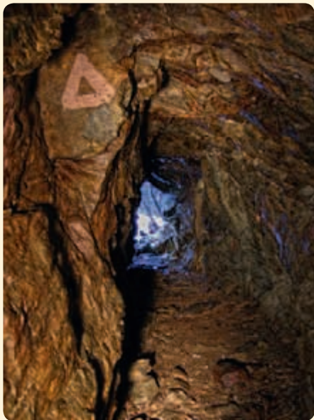
▲ Štolu na snímku procházela část náhonu. Jeho pozůstatky jsou ve svahu Amáline údolí dosud patrné.

Když dorazíte k rozcestníku Zlatý potok, cesta se rozdvouje na dvě trasy, které se liší náročností. Obě procházejí Amáliným údolím, ale ta pohodlnější vede proti proudu Zlatého potoka, kolem