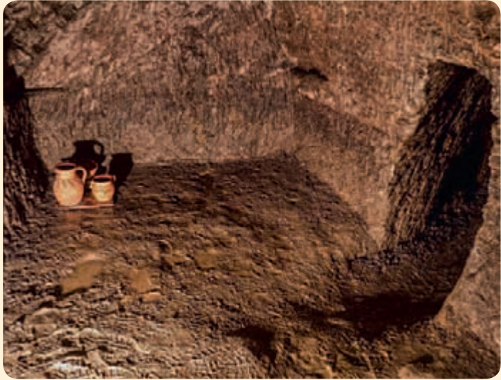
▲ Podzemní prostory vznikaly ještě v době, kdy na místě dnešního zámku stávaly měšťanské domy.

Prohlídka je zajímavá tím, že návštěvníkům mnoho „neusnadňuje“ – počítejte s tím, že nafasujete holinky a budete se v doprovodu průvodce prodírat po kotníky ve vodě úzkými koridory pod historickým centrem města. Dojem z exkurze je tak autentičtější než leckde jinde.