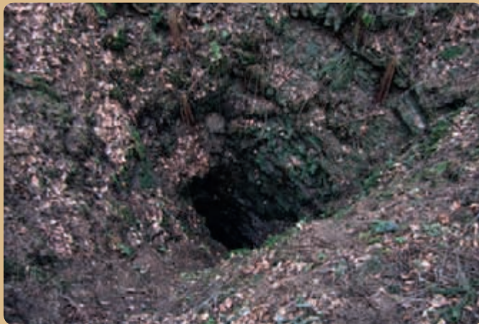
▲ Jírova jáma. Hornické práce u Petrovic a Těšova pocházejí většinou ze 14.–15. století.