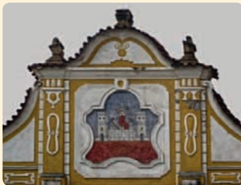
▲ Hornická minulost Kašperských Hor se promítá i do městského znaku.

mlyně na rozemílání zlatonosného křemene. Dnes už si jen těžko dokážeme představit, jaký tu musel panovat shon; za Jana Lucemburského jich tu bylo na tři sta.