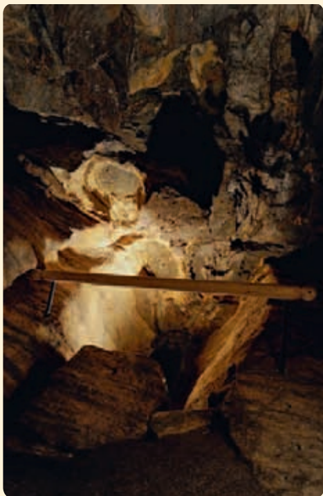
▲ Ve stropě Chýnovské jeskyně se dá dobře pozorovat střídání různě barevných vrstev vápenců a amfibolitů. Pomohly utvořit i známý útvar zvaný Purkyňovo oko.

Otevírací doba: sezonní Cena: od 50 do 99 Kč Informace: Správa jeskyní ČR – Chýnovská jeskyně Dolní Hořice 54 390 55 Chýnov Tel.: 381 299 034, 724 330 365 E-mail: chynov.cave@mybox.cz www.volny.cz/jeskynechynov http://www.jeskynecr.cz/cz/jeskyne/chynovska-jeskyne/ Mapa KČT: č. 41