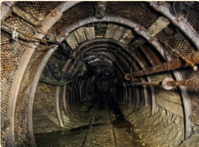
▲ Součástí prohlídky bývá i ukázka vrtání vrtačkou na stlačený vzduch.

Pokud bychom měli jmenovat jednu typicky jihočeskou nerostnou surovinu, bude to grafit. Dobývali ho už Keltové, kteří jej používali jako přísadu do keramiky, největšího rozmachu dosáhla těžba v 19. a 1. polovině 20. století, kdy byly grafitové doly otevřeny například na Kněží hoře u Katovic, u Černé v Pošumaví a také u Českého Krumlova. Krumlovský grafitový důl, který je zpřístupněn veřejnosti, patří k nejmladším – otevřen byl až v roce 1975 a horníci v něm přestali pracovat teprve nedávno.