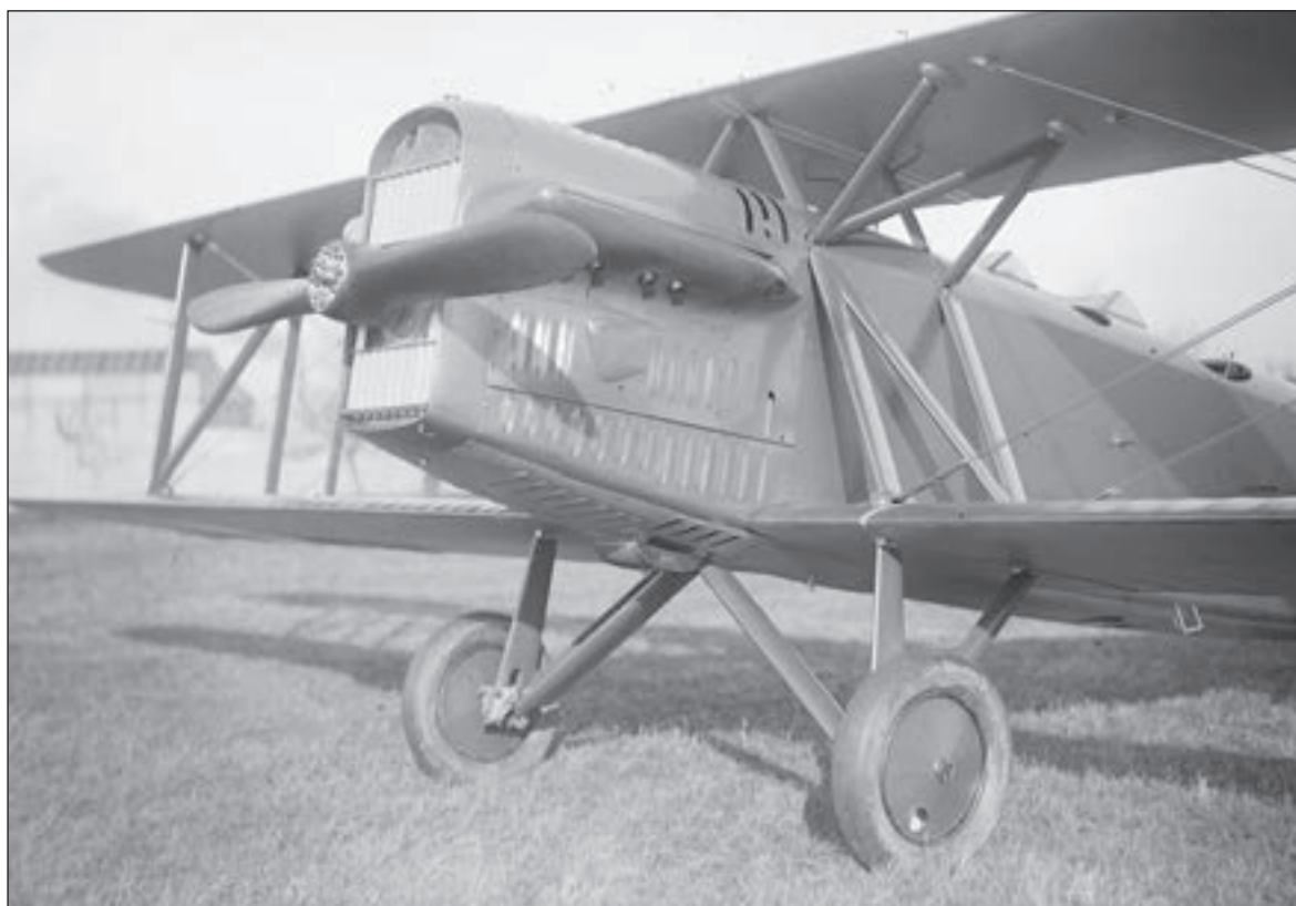
Pozorovací dvouplošník Letov Š-16 patřil k typům, se kterými poručík František Fajtl začal létat v Olomouci u Leteckého pluku 2.